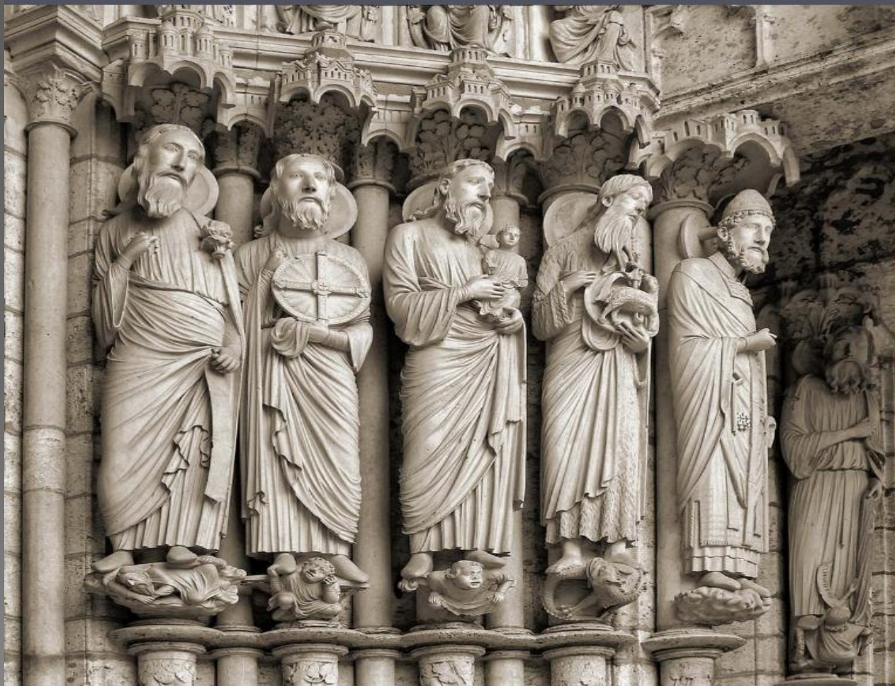
Шартрский собор. Скульптуры королевского портала