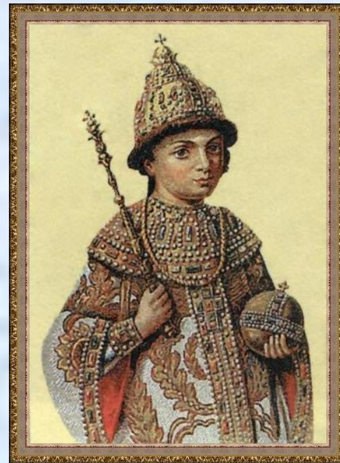
Петр I Алексеевич