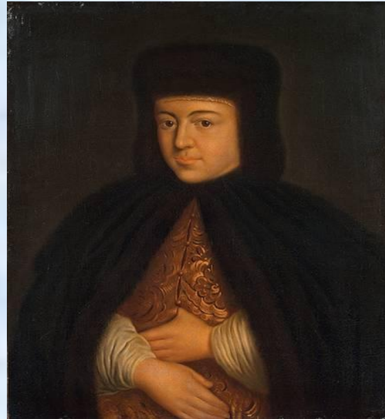
Наталья Кирилловна Нарышкина, мать Петра