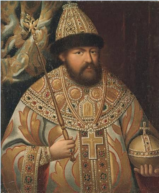
Алексей Михайлович, русский царь, отец Петра

Петр был младшим сыном царя Алексея Михайловича. Царь Алексей был женат два раза. От первого брака у него было 13 детей. Многие из них умерли ещё при жизни отца, и из сыновей только Федор и Иван его пережили, хотя и были оба серьезно болезненными. Царь был очень рад рождению сына.