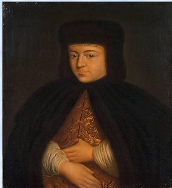
Наталья Кирилловна Нарышкина, мать Петра