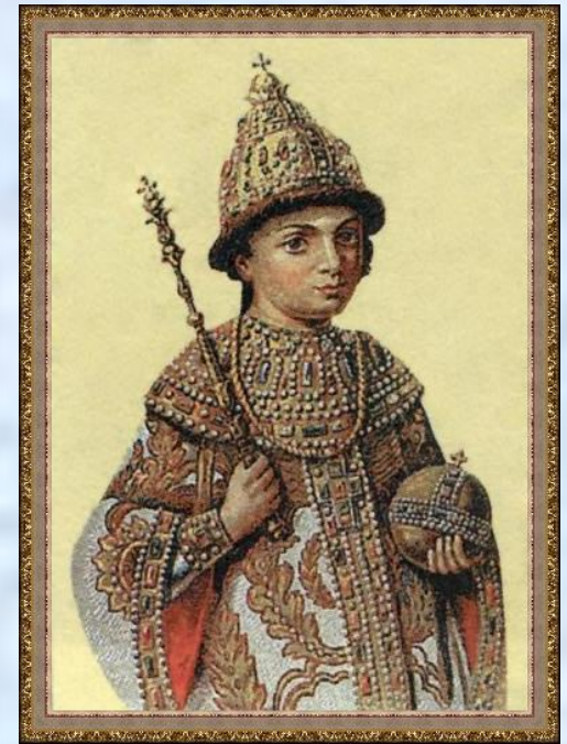
Петр I Алексеевич