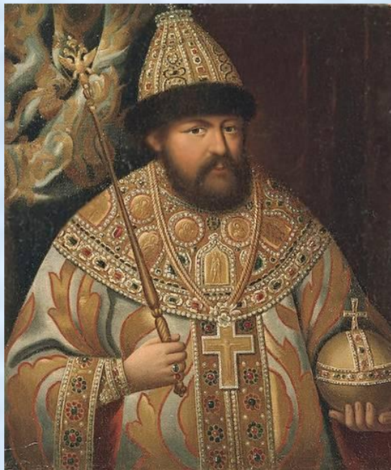
Алексей Михайлович, русский царь, отец Петра

Петр был младшим сыном царя Алексея Михайловича. Царь Алексей был женат два раза. От первого брака у него было 13 детей. Многие из них умерли ещё при жизни отца, и из сыновей только Федор и Иван его пережили, хотя и были оба серьезно болезненными. Царь был очень рад рождению сына.