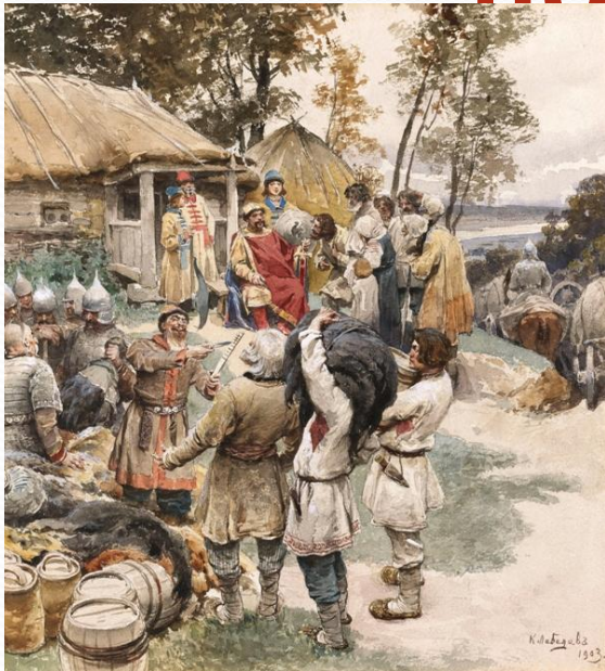
Князь Игорь собирает дань с древлян в 945 году («Полюдье») Худ. К.В. Лебедев