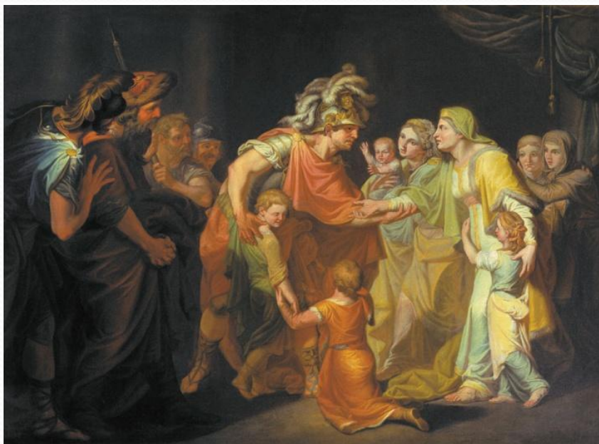
Великий князь Святослав, целующий мать и детей своих по возвращении с Дуная в Киев. И. А. Акимов, 1773 г.