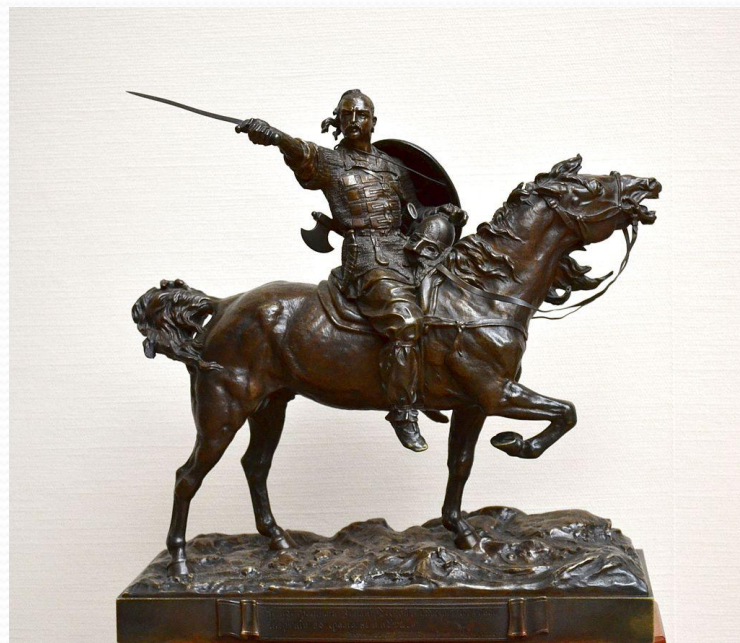
Князь Святослав на пути в Царьград Скульптор Е.А. Лансере