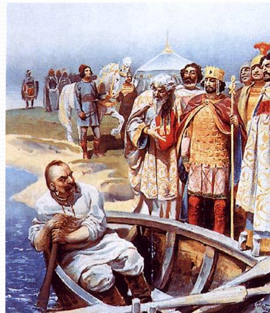
Встреча Святослава с Иоанном Цимисхием. К. Лебедев, 1916