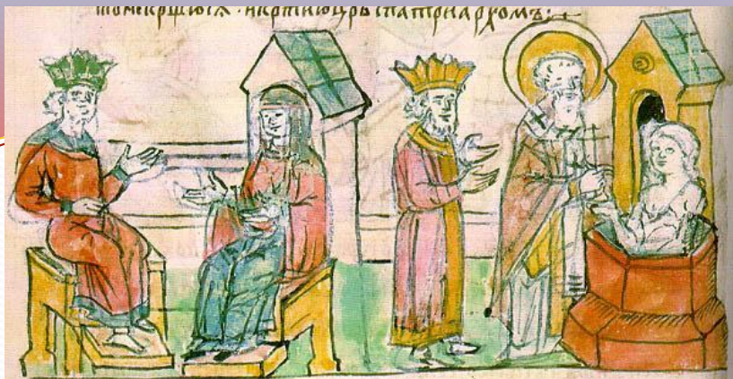
Крещение княгини Ольги в Царьграде. Миниатюра из Радзивилловской летописи, 15 век