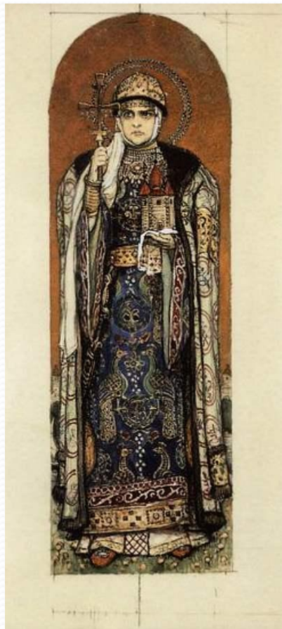
Святая равноапостольная княгиня Ольга Худ. В. М. Васнецов