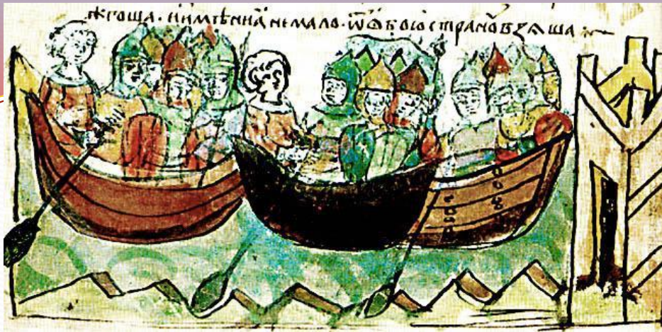
Поход Игоря. Иллюстрация из Радзивилловской летописи