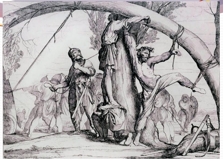
«Казнь князя Игоря». Рисунок Ф. Бруни