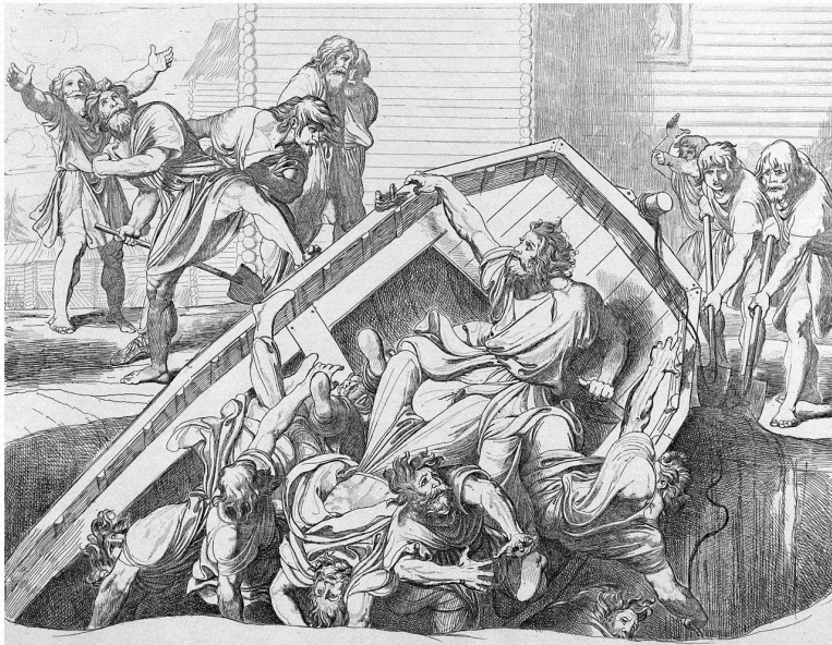
«Мщение Ольги против идолов древлянских». Гравюра Ф. А. Бруни, 1839.