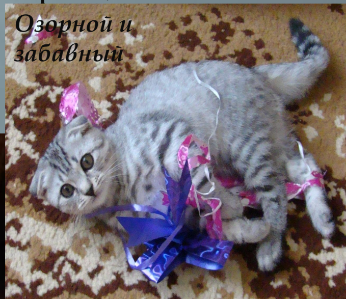
Озорной и забавный