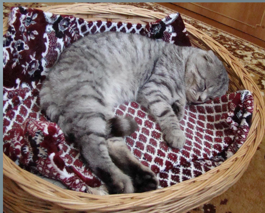
№2: Взрослый Луксор