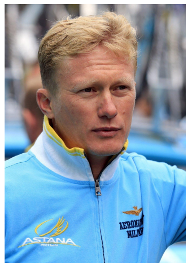
Александр Винокуров Олимпийский чемпион, спортивный менеджер