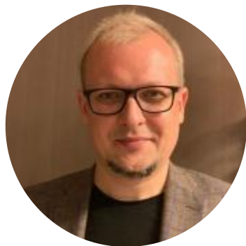
Александр Фролов Президент