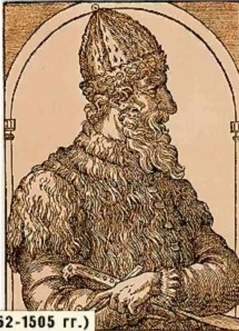
Иван III (1462-1505 гг.)