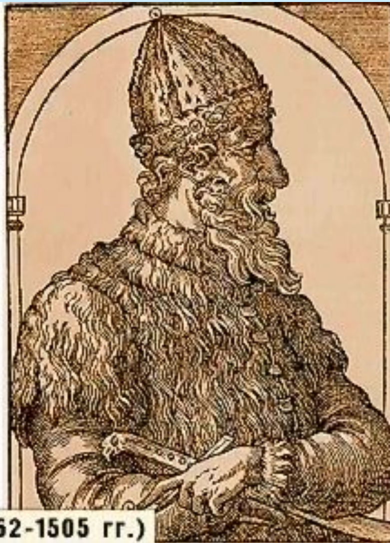
Иван III (1462-1505 гг.)