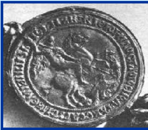
Печать Ивана III