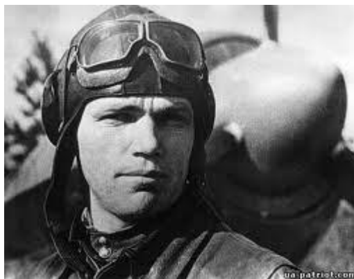
Иван Никитович Кожедуб

(1920–1991), маршал авиации (1985), Герой Советского Союза (1944 – дважды; 1945). В Великую Отечественную войну в истребительной авиации, командир эскадрильи, заместитель командира полка, провёл 120 воздушных боёв; сбил 62 самолёта.