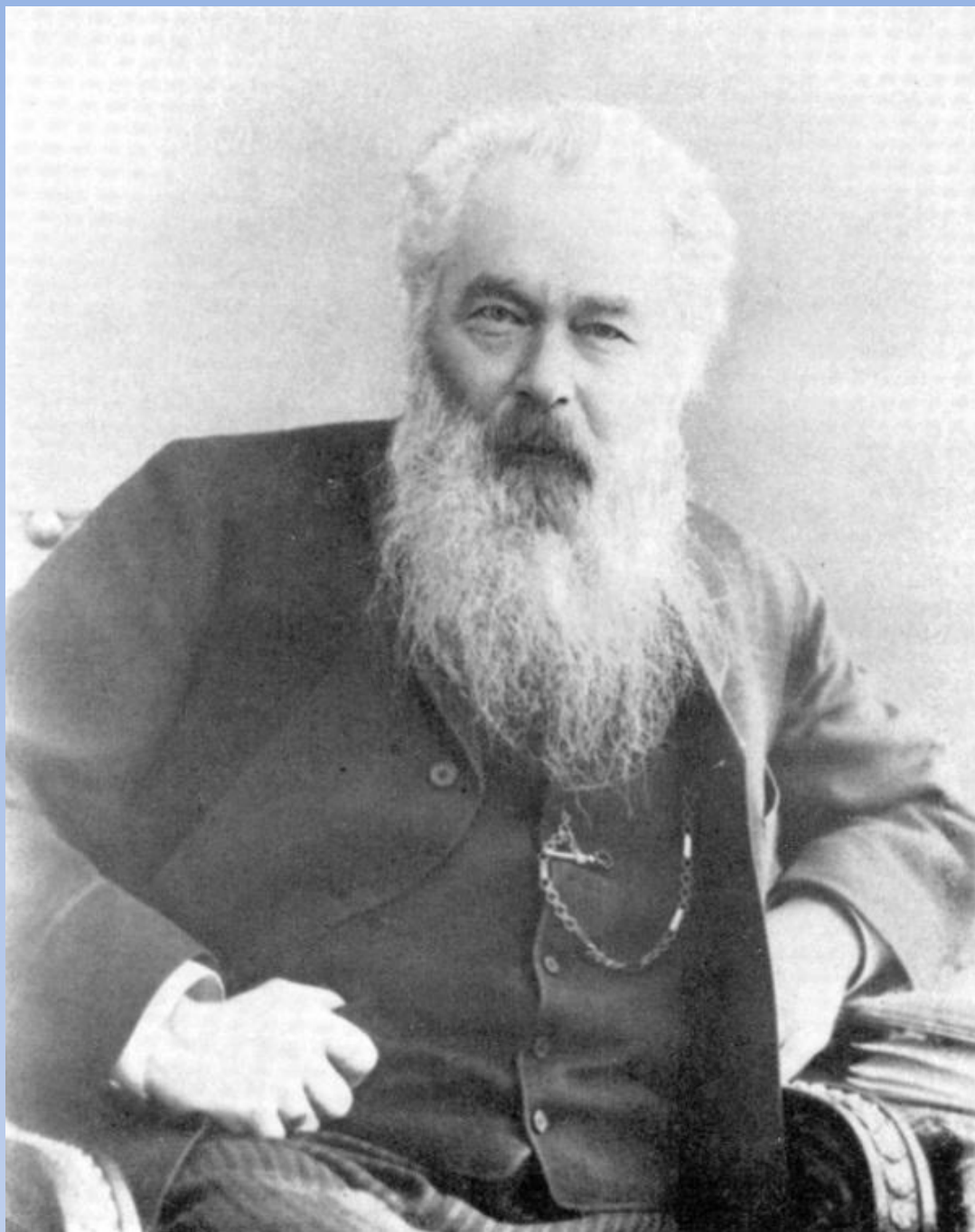
Иван Иванович Шишкин