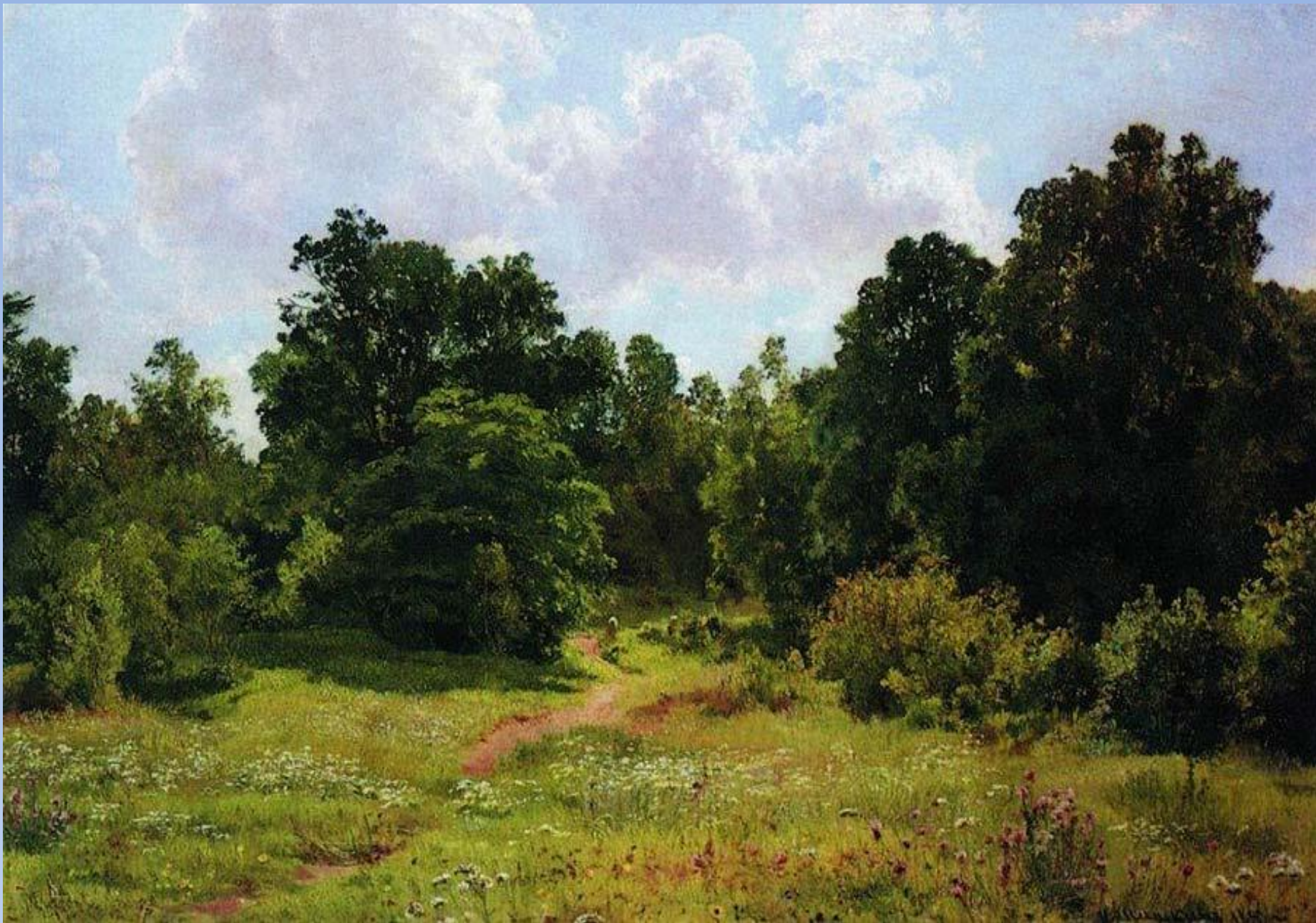
«Опушка лиственного леса»