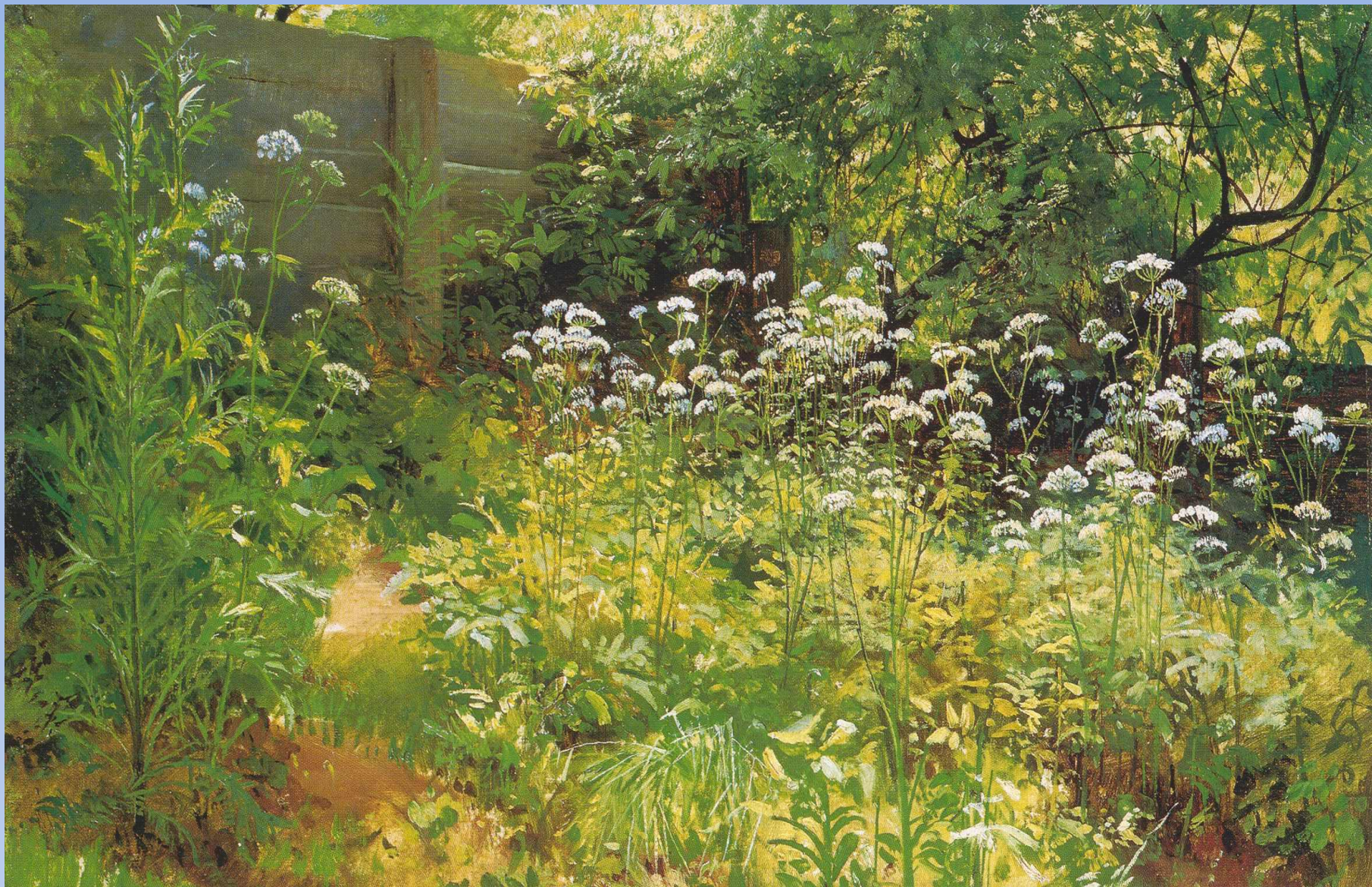
«Уголок заброшенного сада»