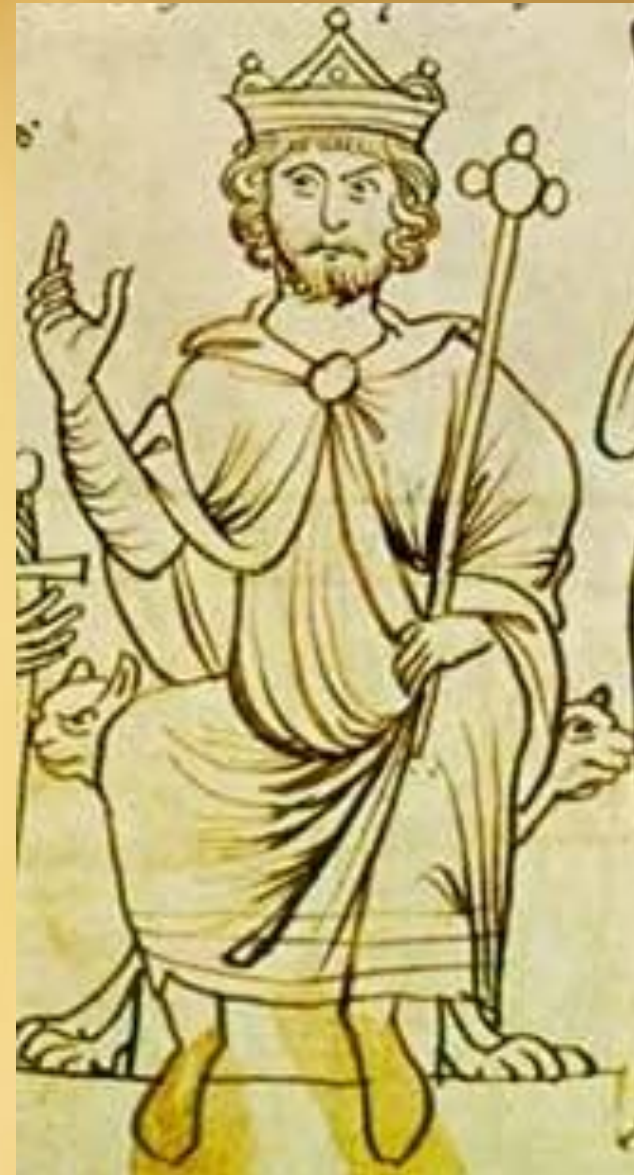
Оттон I. Изображение XIII

962 г. – образование Священной Римской империи (Оттон I)