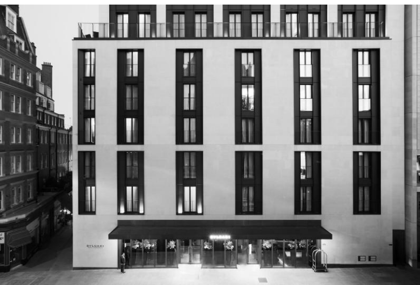
Bulgari Hotel & Resort, London (UK), 2012