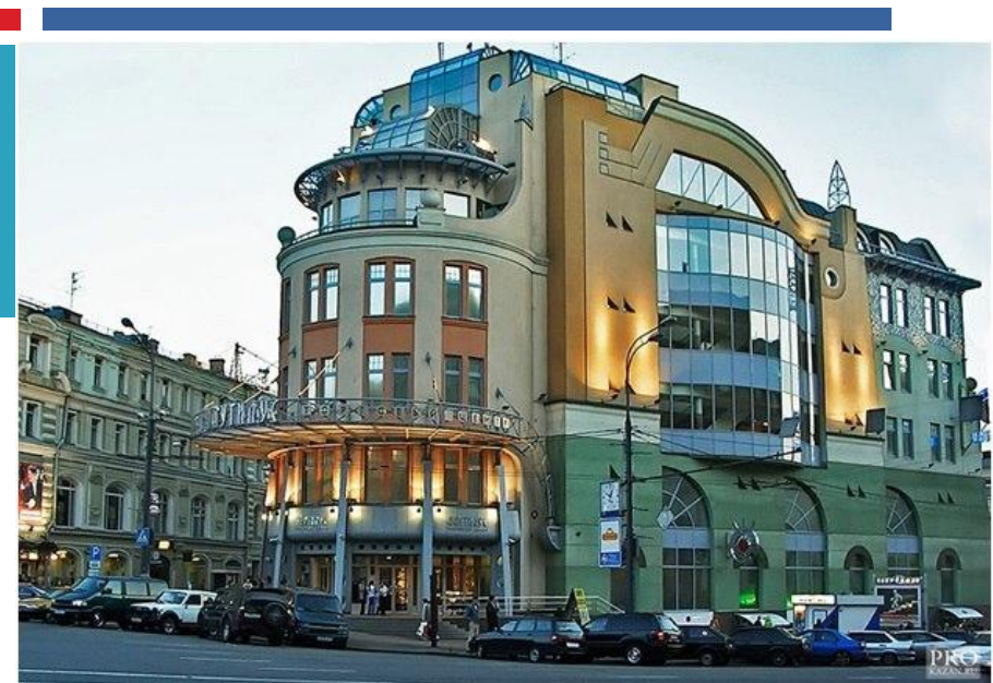
ТРЦ "Наutilus" (Москва). Сочетание совершенно не сочетаемых элементов. Цветовая гамма так же безвкусна, как будто из того что было. Форма здания как будто так же создана из кусков здания, которые попались под руку.

Не нравится, как решен вопрос с остеклением, эти понатыканные однообразные окна. Главный вход вроде бы выделен, но совсем как то не интересно. Абсолютно обычная архитектура здания, не выделяющая его из остальной серой массы. Нет какого то отличительного запоминающегося элемента.