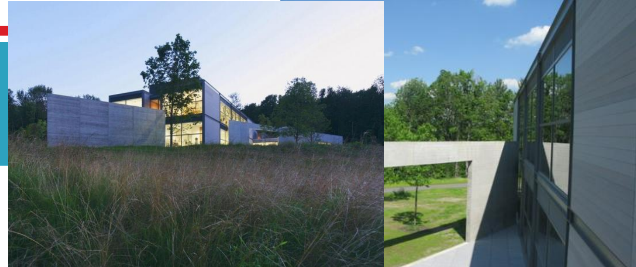
Центр Стоун-Хилл Института искусств Кларк