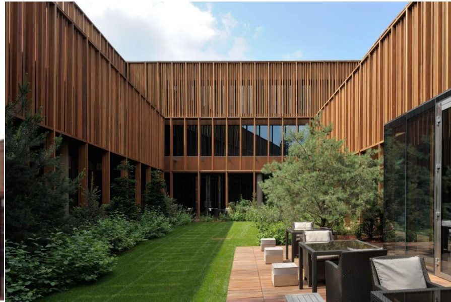
Hotel & SPA at the Barvikha Luxury Village, Moscow (Russia), 2009