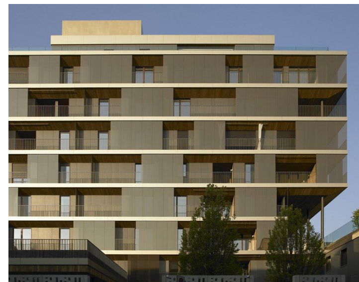
Residential building on via Salaino 10, Milan (Italy), 2011