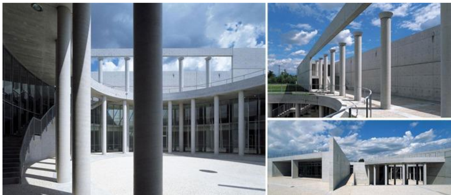
Фабрика (Тревизо, Италия, 1992-2000г.)