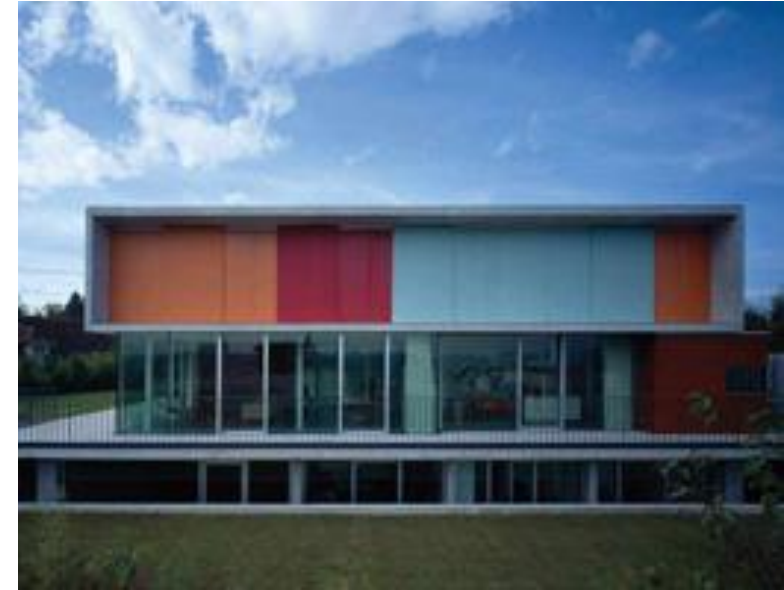
Private house in Basel (Switzerland), 2006