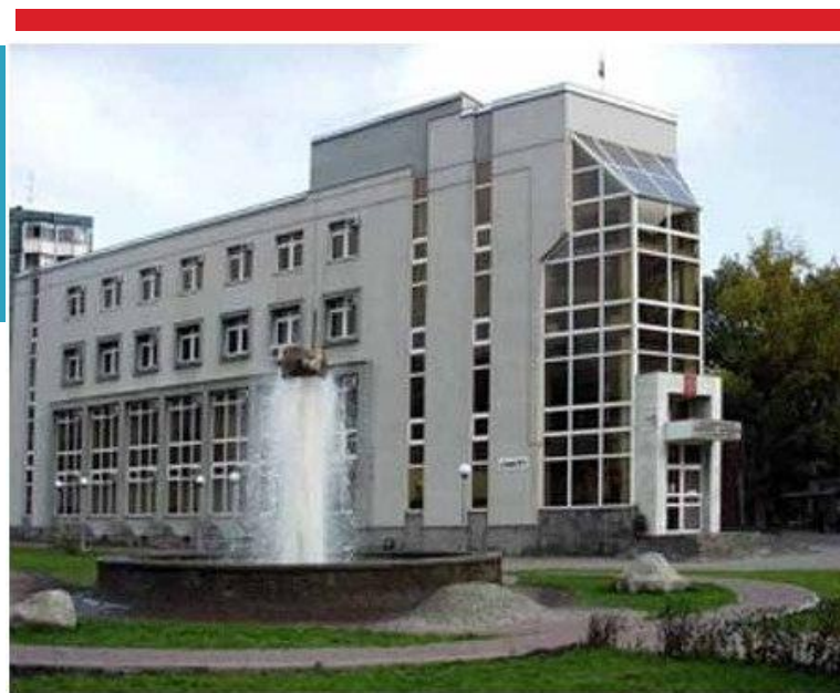
Административное здание инспекции ИФНС РФ по Первомайскому району г. Ростова-на-Дону.

Не нравится вставка однотипных не интересных СИНИХ окон на главный фасад. Как? Зачем? Почему? Не понятно. Архитектура скушна и совсем не вызывает интереса. И не понятная конструкция на крыше тоже не особо нравится. Нельзя даже сказать, что здесь нелепое сочетание чего то... так как нечего даже сказать, что тут хотели сочетать □