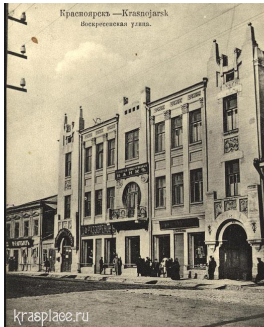
Красноярск, дом Токарева (пр. Мира, 76)