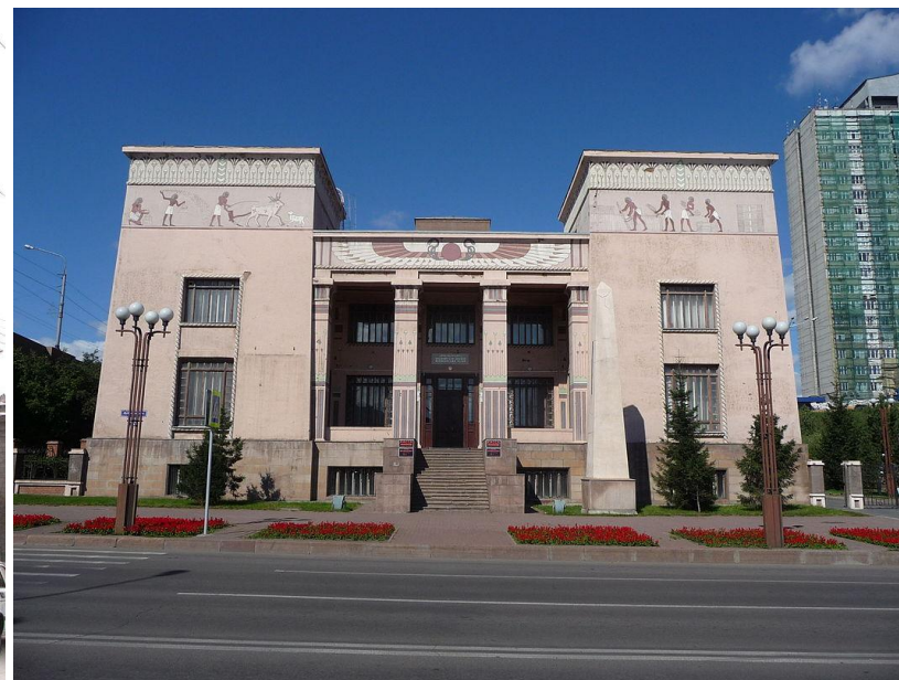
Красноярский краеведческий музей