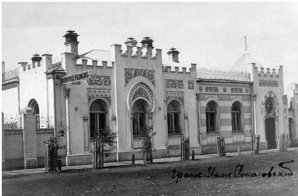
Красноярск, особняк нотариуса Ицына (ул. Кирова, 24)