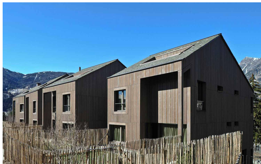
Eden Hotel, Bormio (Italy), 2012