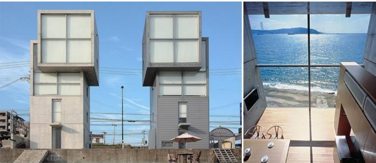
Дом 4 × 4 (Кобе, Хёго, 2001-2003г.)