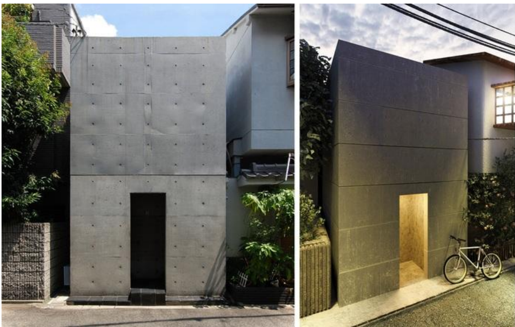
Роу-хаус (Сумиёси, Осака, 1975-1976г.)