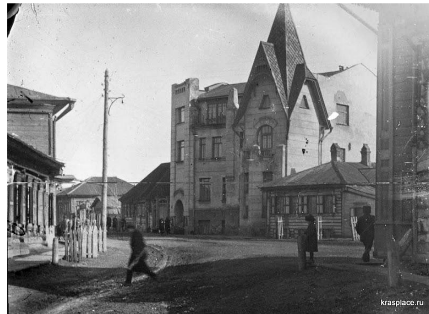
Красноярск, собственный дом- усадьба в 1906 — 1912 (ул. Марковского, 21)