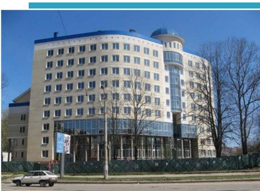
Административное здание налоговой инспекции Смоленской области в г. Смоленск, РФ.

Не нравится вставка однотипных не интересных СИНИХ окон на главный фасад. Как? Зачем? Почему? Не понятно. Архитектура скушна и совсем не вызывает интереса. И не понятная конструкция на крыше тоже не особо нравится. Нельзя даже сказать, что здесь нелепое сочетание чего то... так как нечего даже сказать, что тут хотели сочетать □