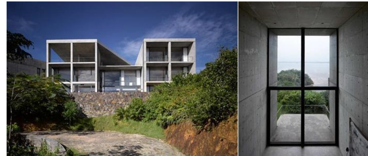
Дом Пьера Пренжье (Шри-Ланка, 2010г.)