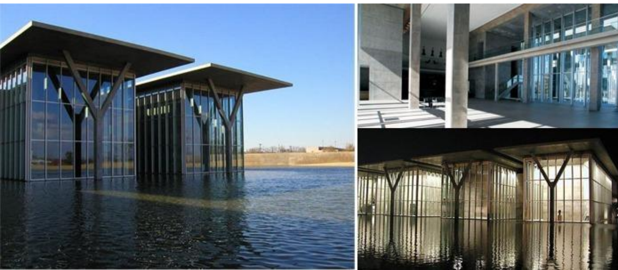
Modern Art Museum (Форт-Уэрта, 1997-2003г.)