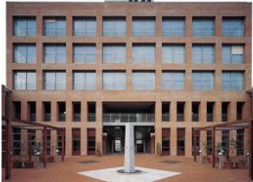
Commercial and administrative building complex in Seregno (Italy), 1987