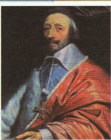
Кардинал Ришелье. Художник Ф. де Шампень

КОР. к западу от Гринвича к востоку от Гринвича