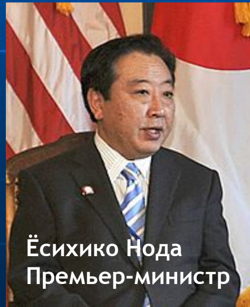
Ёсихико Нода Премьер-министр