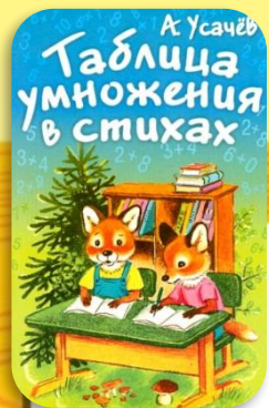
Таблица умножения на 3 в стихах А. Усачев