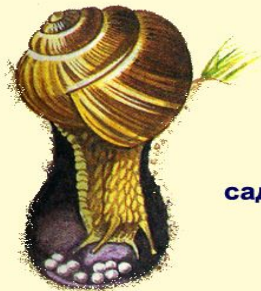
размножение виноградной улитки