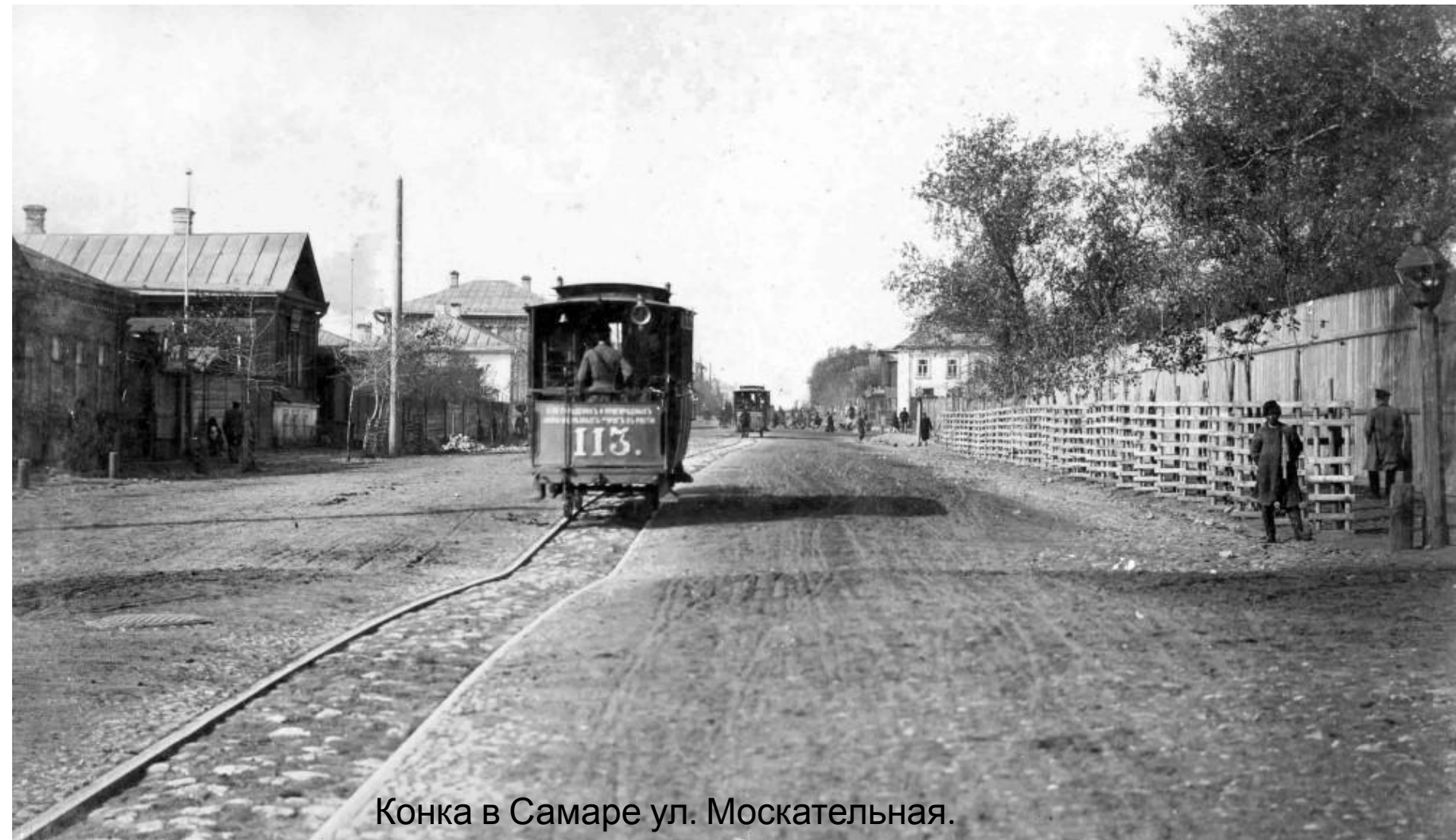
Конка в Самаре ул. Москательная. 1891 г.