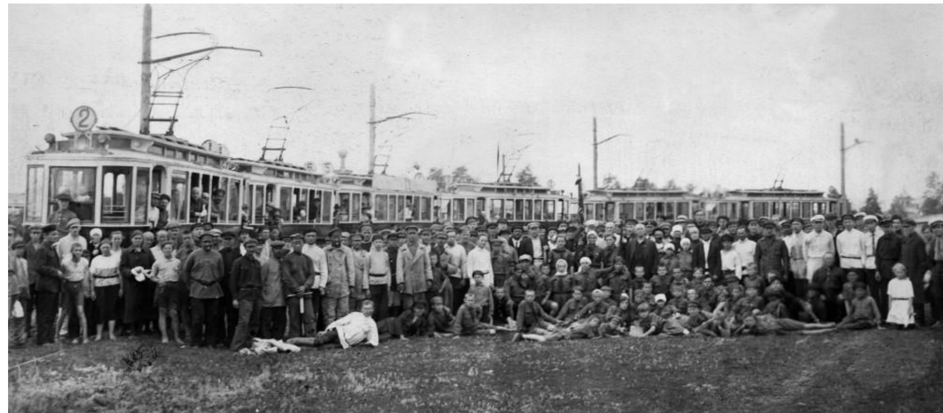
Работники трамвайного депо. Год 1935-1936.