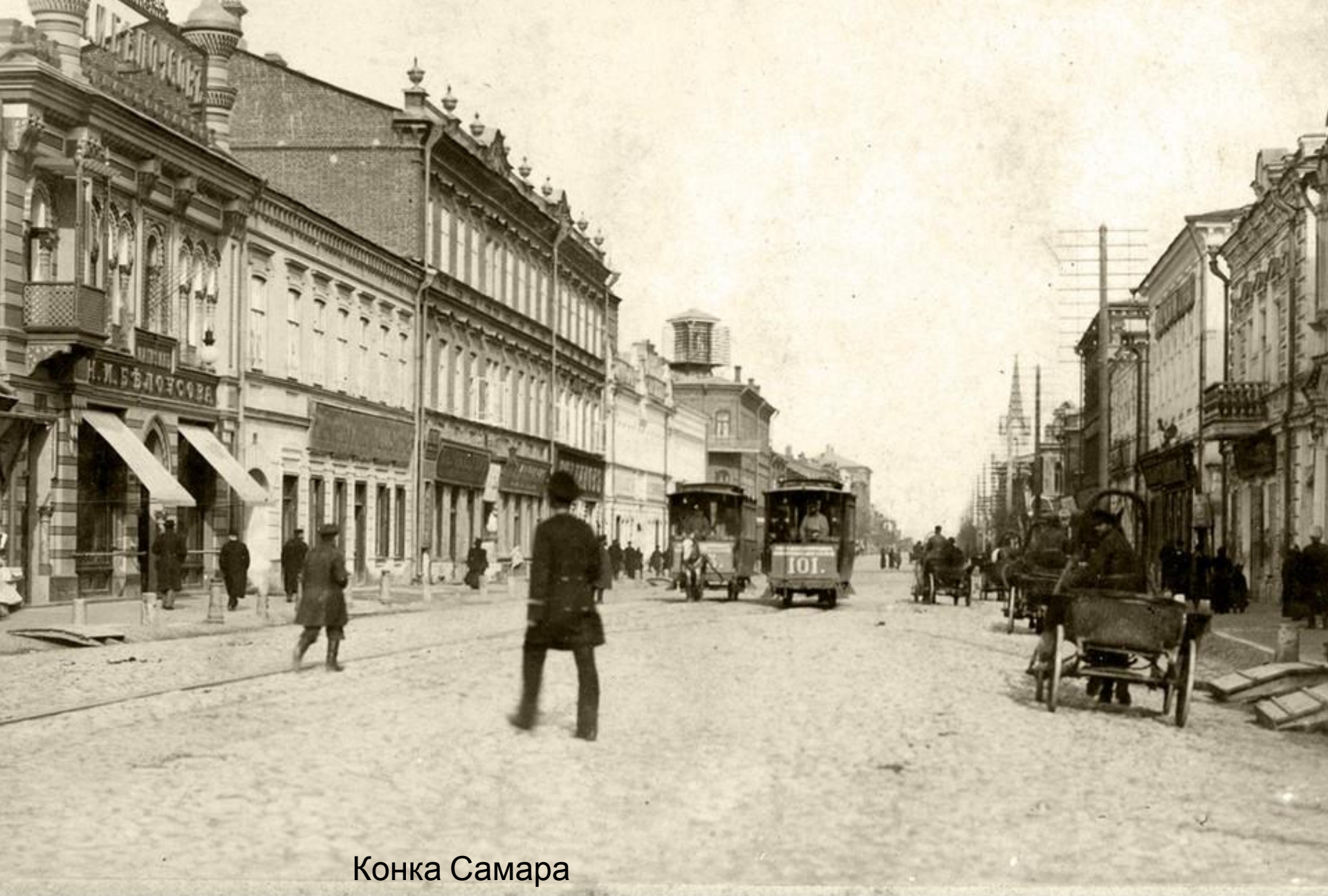
Конка Самара 1911г.