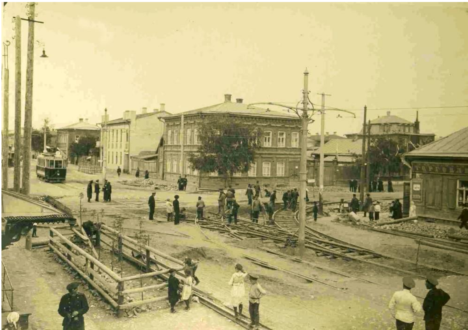
Укладка первых рельсов.