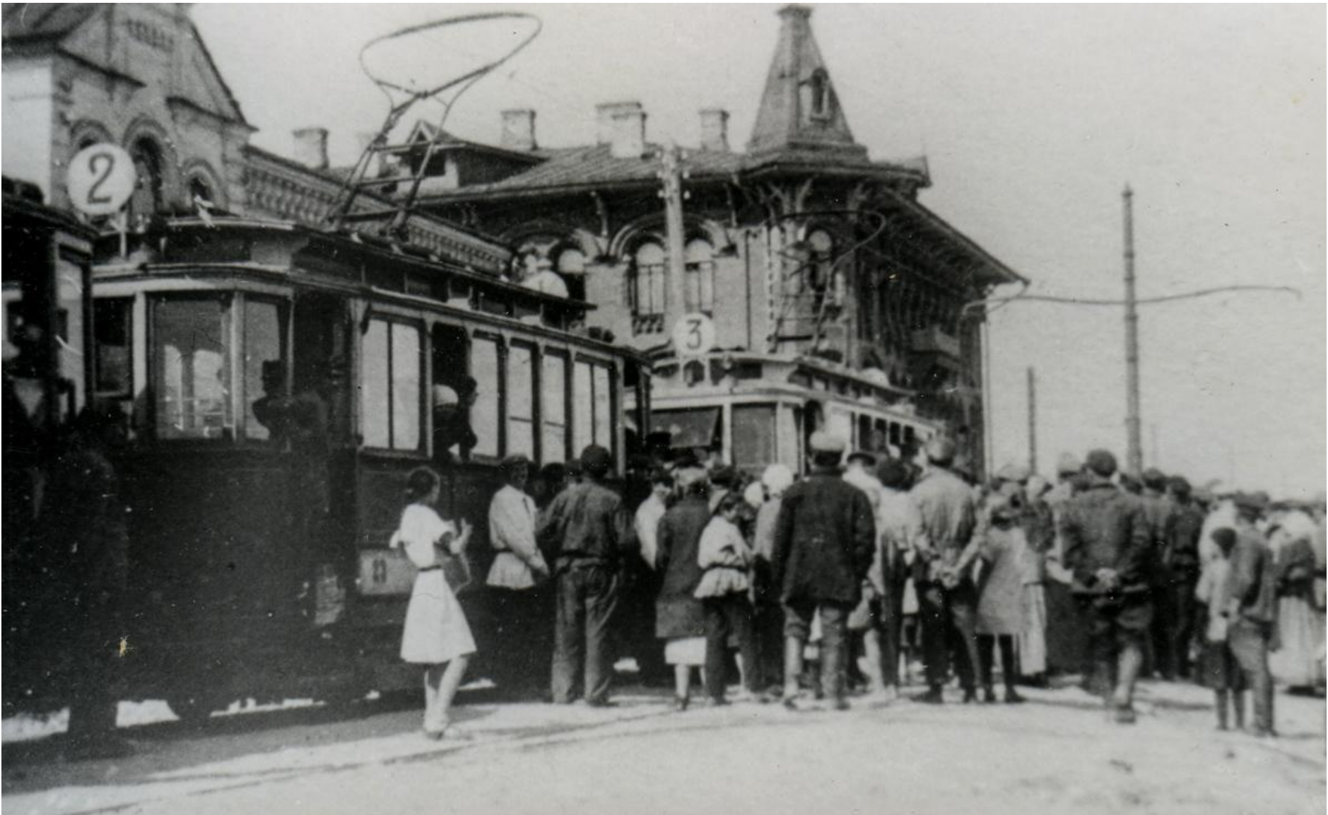
Г. Самара Вокзал. 1928г.