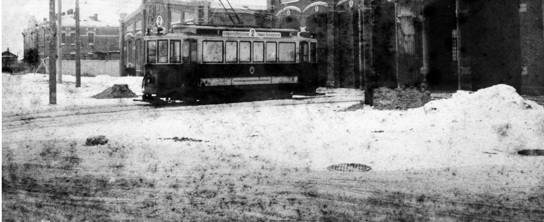
1914г. Первое трамвайное депо.