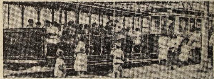
Так выглядели первые трамвайные поезда.

...в 1954 — уложены вторые трамвайные пути от Оврага подпольщиков до завода Катэк, введена в эксплуатацию электростанция № 4 около металлургического завода. Следующий год — опять новая трасса: от Катэка до поляны Фрунзе. И так год за годом. За последние три го-