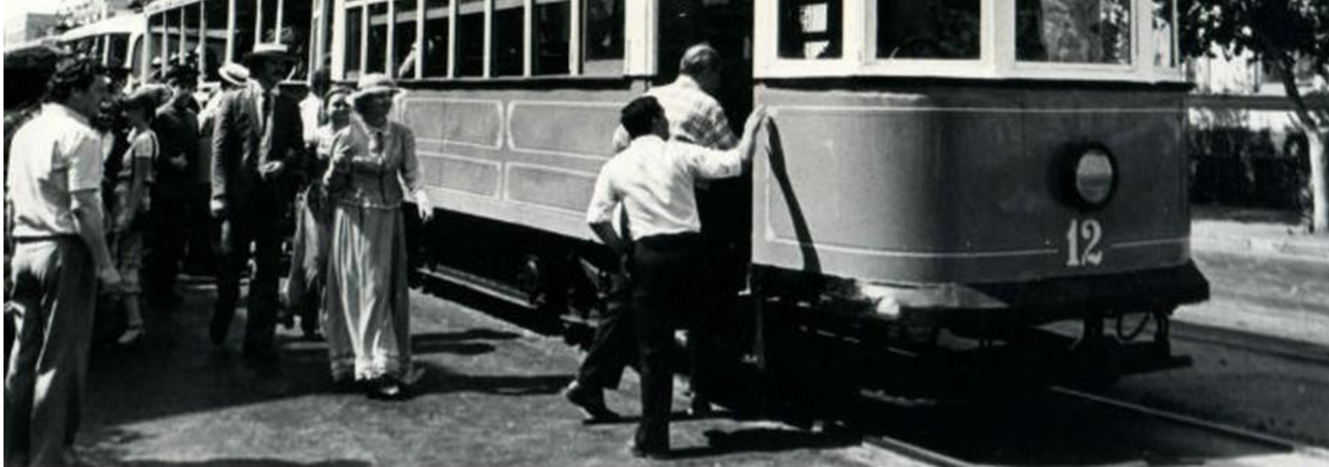
Первые трамваи 1915г.