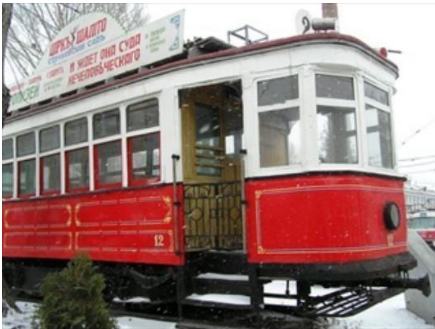
Первый трамвай 12-112