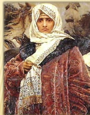
Боярыня Марфа Борецкая

Долгое время эта старинная русская деревня входила в состав приморских вотчин знаменитой новгородской боярыни Марфы-посадницы (вдовы посадника Исаака Борецкого), занимавшей в XV веке первое место среди новгородских феодалов по размерам владений в Карелии. После падения новгородской боярщины и включения Новгородской республики в состав единого русского государства все владения новгородских бояр в Карелии были конфискованы и «отписаны на государя», а часть из них, особенно на беломорском побережье, передана в ведение Соловецкого монастыря. Близ Вирмы обнаружен каменный фундамент солеварен Соловецкого монастыря (XVI–XVII века).