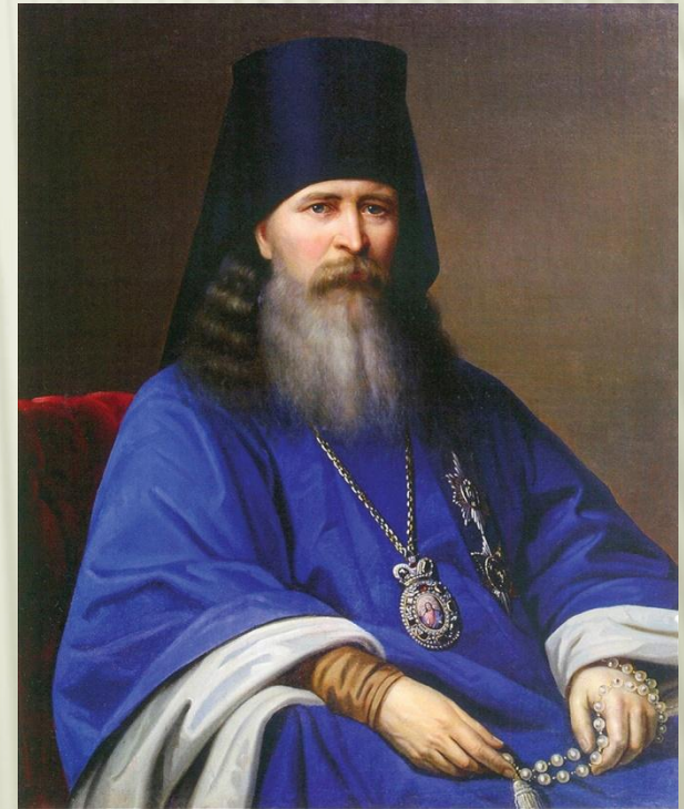
Епископ Феофан (Затворник)