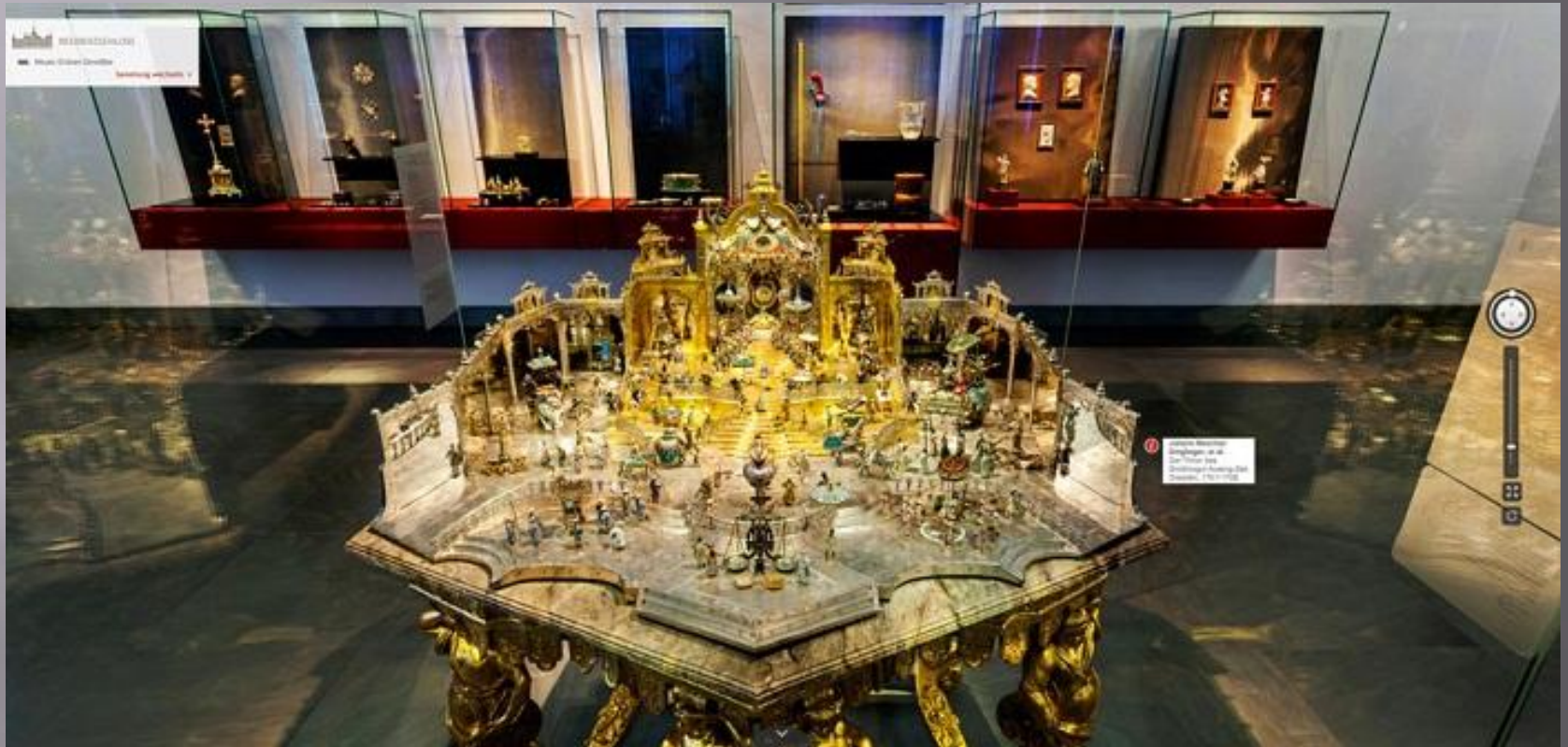
Самая знаменитая работа Динглингера в музее