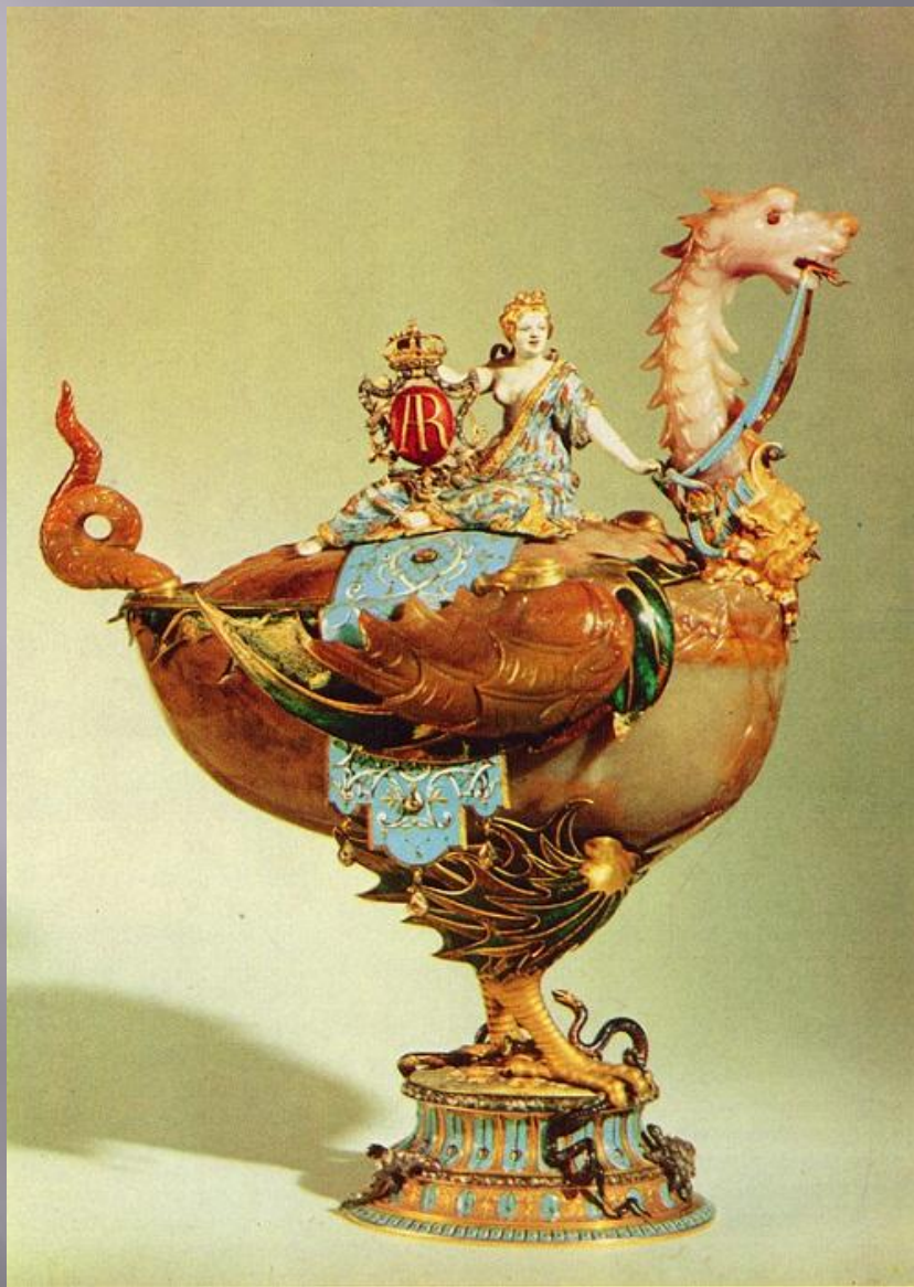
Чаша в виде дракона с Медеей на крышке. Мастер И. М. Динглингер. Дрезден. До 1709 г. Сардоникс, золото, алмазы, эмаль