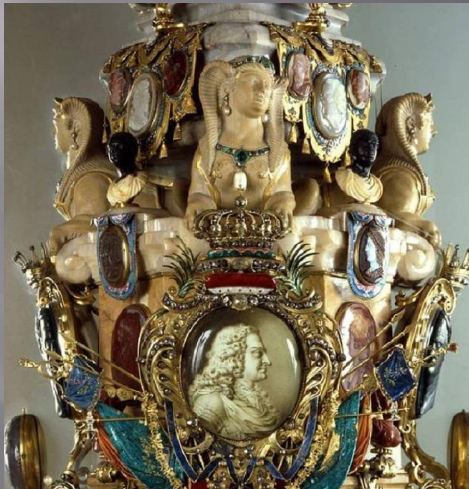
«Обелиск Августа» работы И. М. Динглингера. 1721 г. Высота 2,3 м, Дрезден