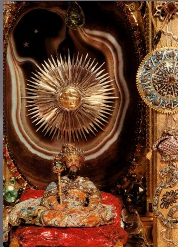
Фрагмент. Могол восседает на троне