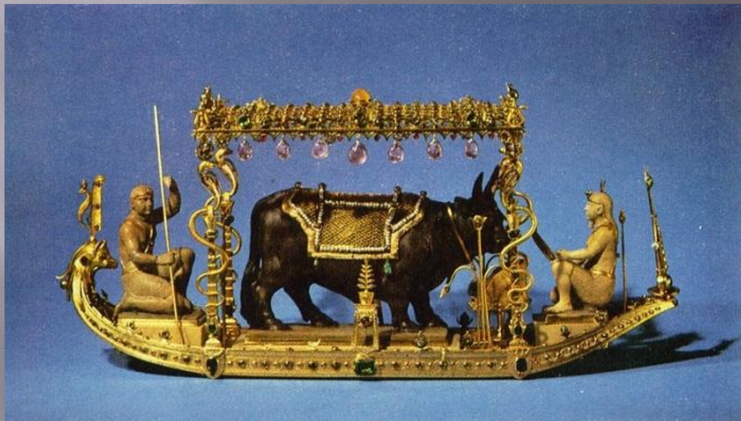
Барка на Ниле со священным быком Аписом. Часть алтаря Аписа.