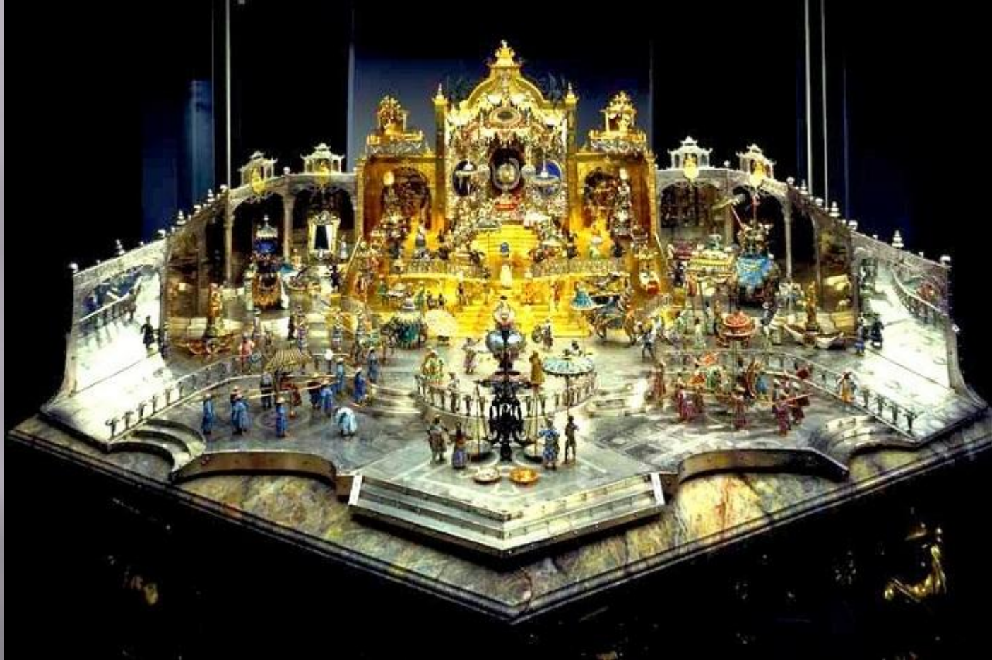
Двор Великого Могола Аурагг-Зеба