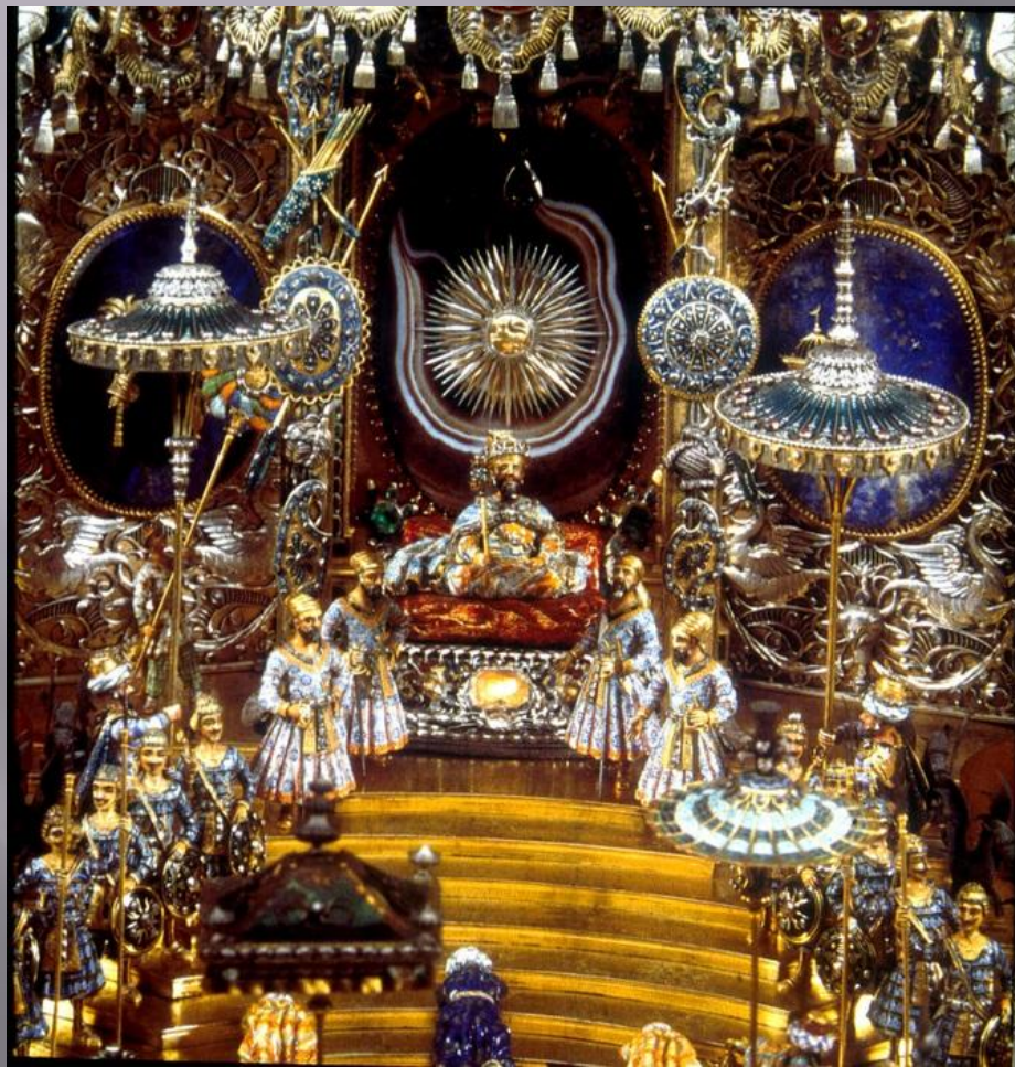
Фрагмент. Могол восседает на троне