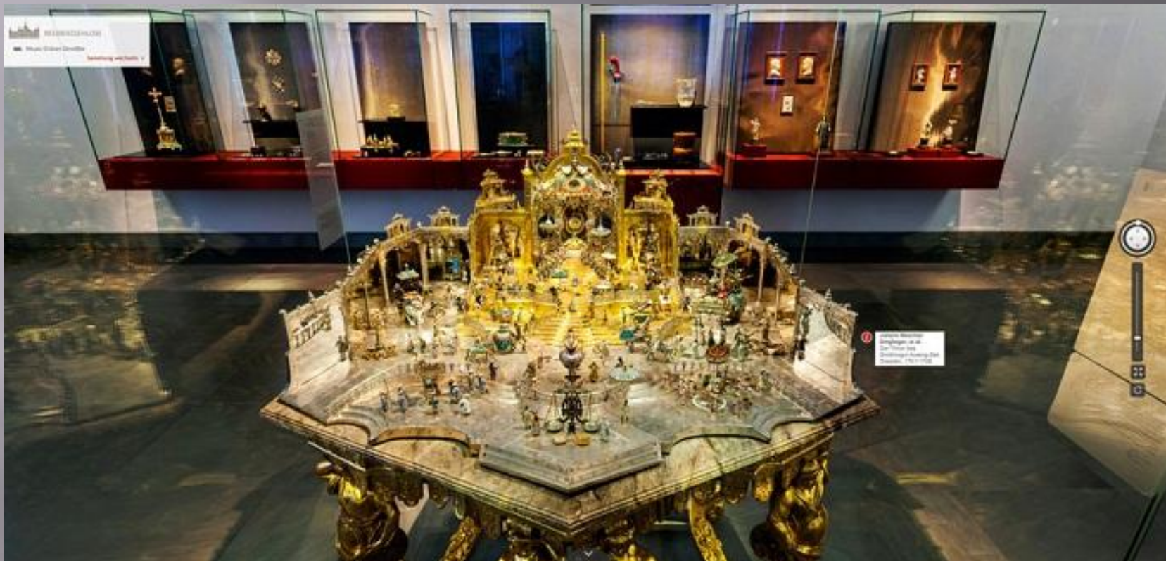
Самая знаменитая работа Динглингера в музее