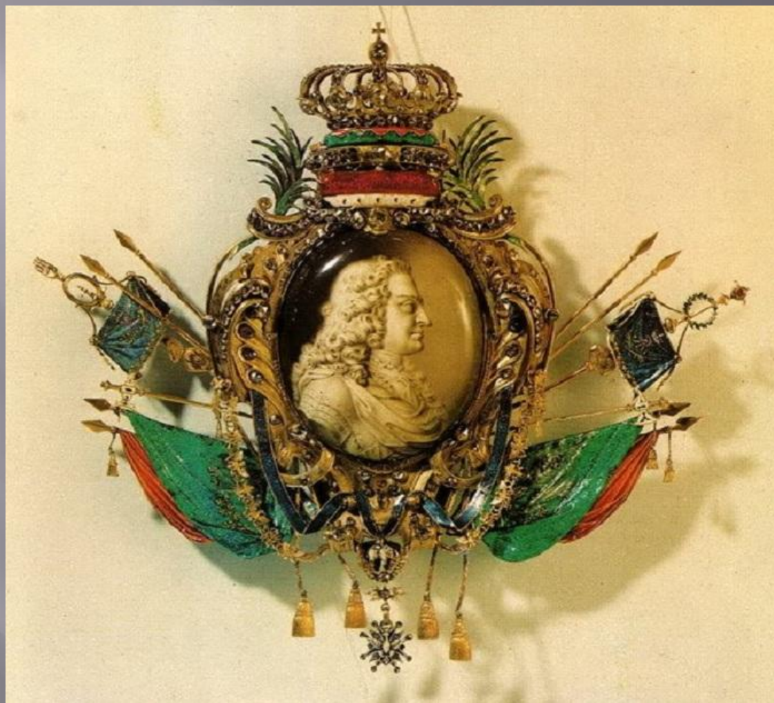
Картуш с портретом Августа Сильного на медальоне. Часть «Обелиска Августа» работы И. М. Динглингера Высота 22,5 см. Дрезден