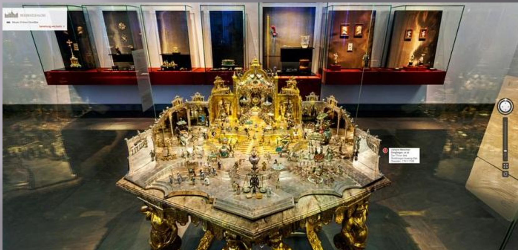
Самая знаменитая работа Динглингера в музее