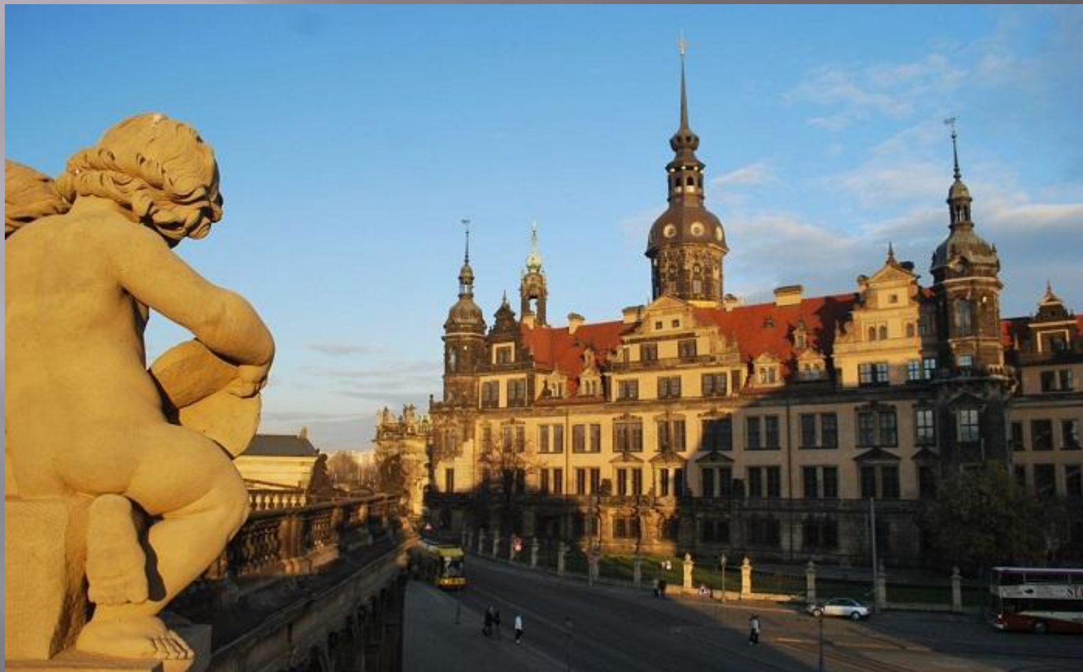
Музей «Грюнес Гевёльбе»

В наши дни великолепные работы Динглингера хранятся в знаменитом музее Дрездена «Грюнес Гевёльбе» - «Зеленые своды».