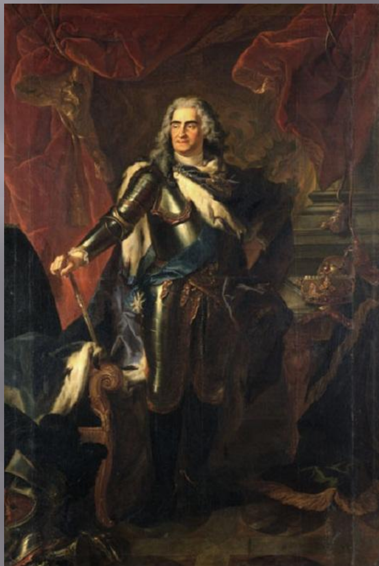
«Король Август II». Луи де Сильвестр. 1718.