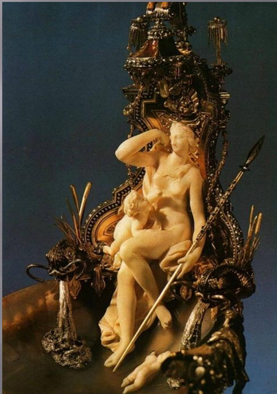
Купальня Дианы. Деталь