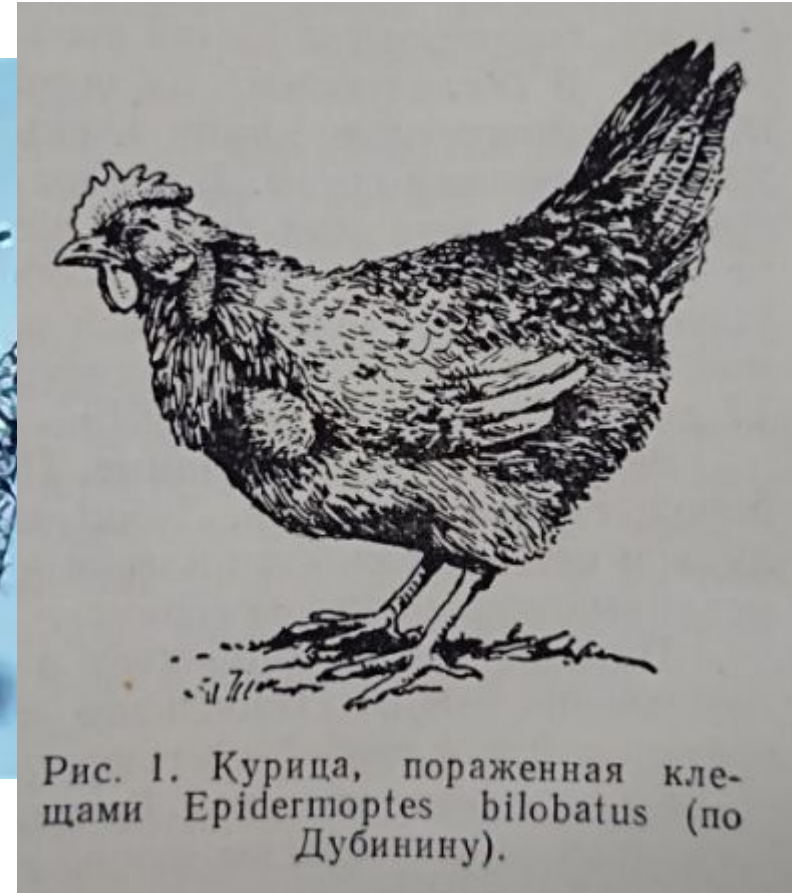
Рис. 1. Курица, пораженная клещами Epidermoptes bilobatus (по Дубинину).