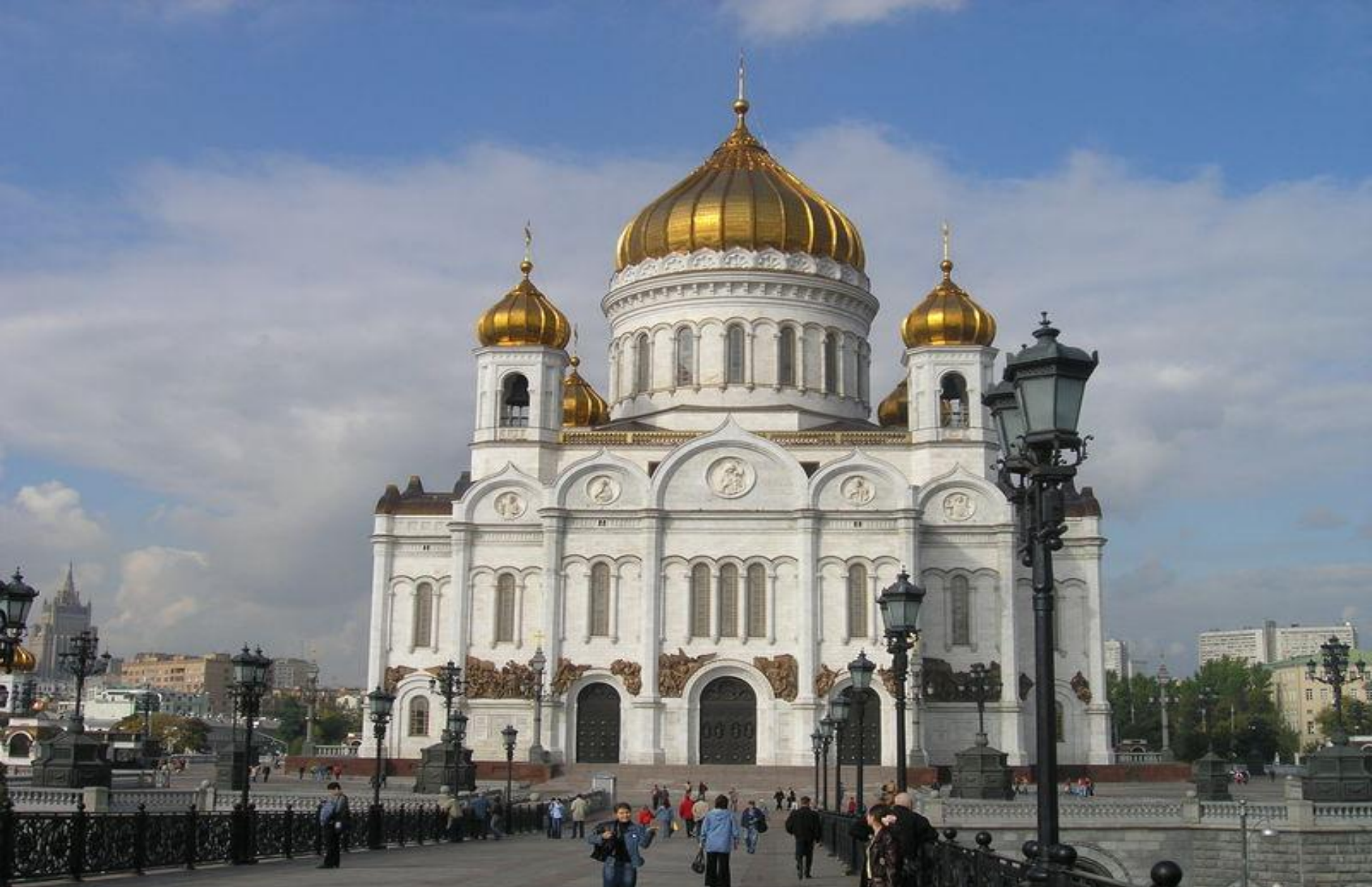
ХРАМ ХРИСТА СПАСИТЕЛЯ НА ВОЛХОНКЕ