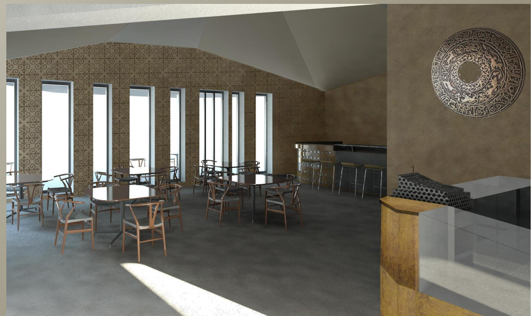
Кафе и сувенирный киоск

кухни, обеденного зала вместимостью до 40 человек с возможностью организации в летний период «летнего кафе», сувенирного магазина, комнаты охраны, билетной кассы, двух технических помещений, включающих узел отопления и туалеты, в том числе – туалет для людей с ограниченными возможностями.