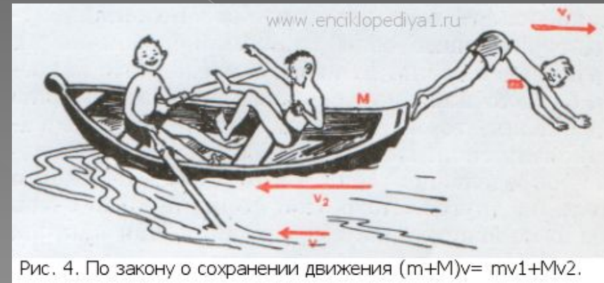
Рис. 4. По закону о сохранении движения (m+M)v=mv_1+Mv_2 .

Единицы измерения силы- Н или \text{кг}\cdot\text{м}/\text{с}^2