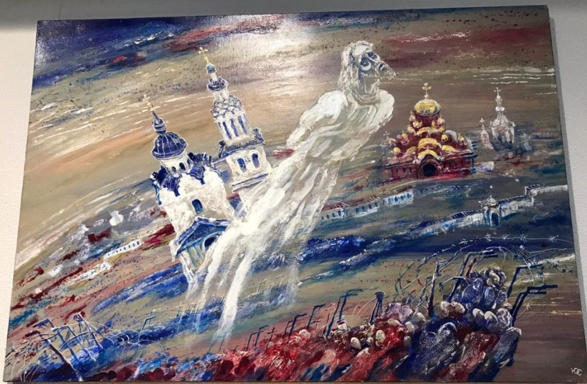
Описание грядущего апокалипсиса С. М. Тихонов Смесь гуаши, акварель, масло Февраль 2014 г. Лист, бумага Из частной коллекции

Тихонов Сергей «Виза Восточного Бума» см. техн. 2015 г. Масло, акварель, карандаш