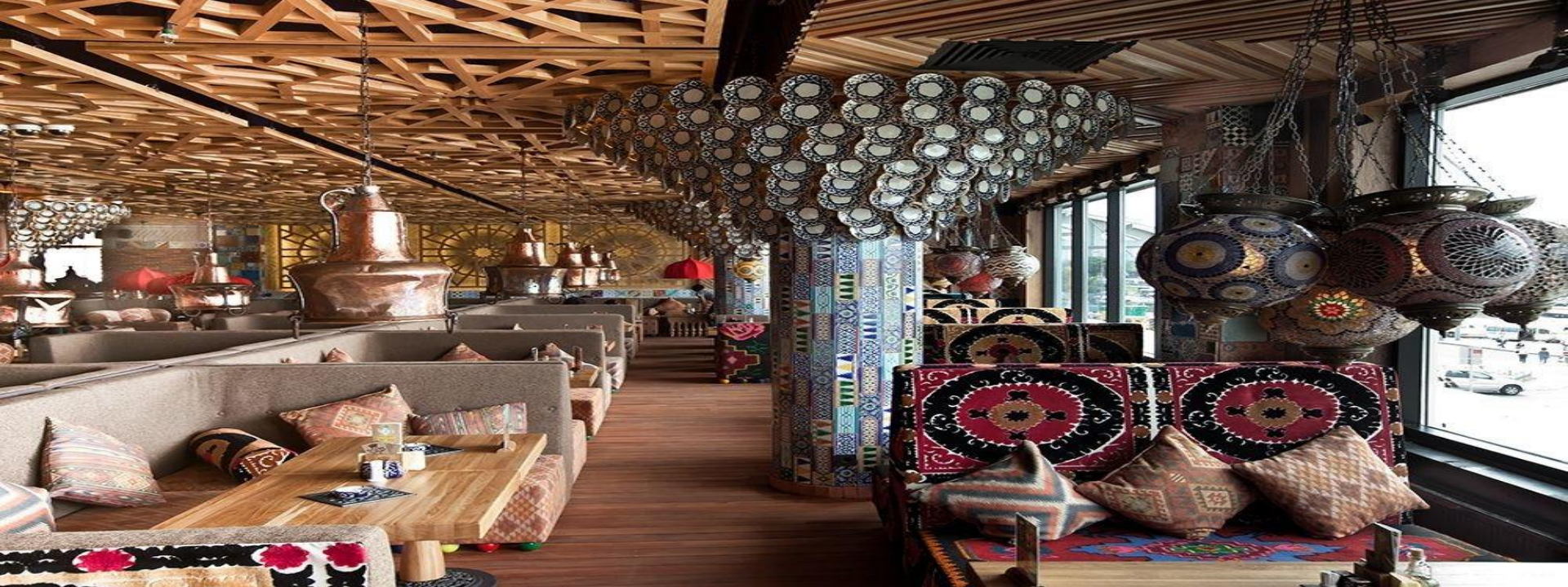
Кафе «Чак-Чак» в гостинице «ЛЭЗЭТ»