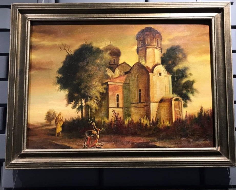
Св. Лука и Боровецкая Церковь Лукиана Холмск, м. Из частной коллекции