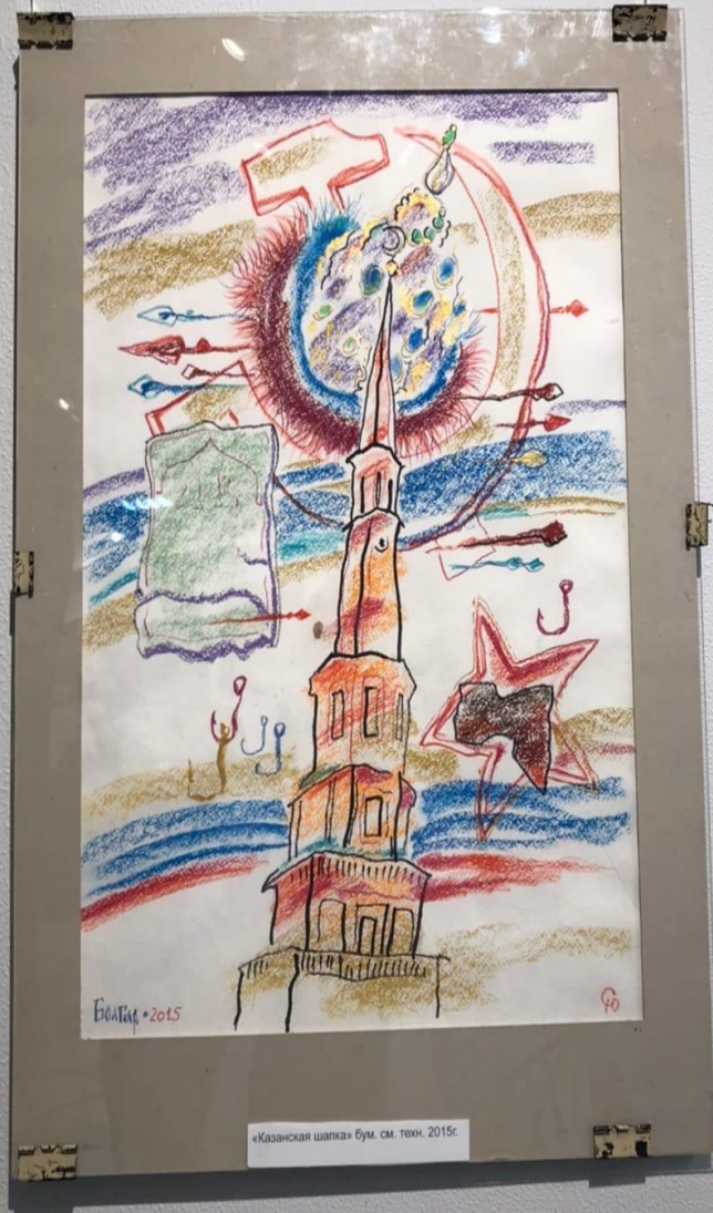
«Казанская шапка» бум. см. техн. 2015г.

Кузнецов Кирилл «Казанская шапка» 2015 г. Бумага, акварель, ак. черн. Из частной коллекции