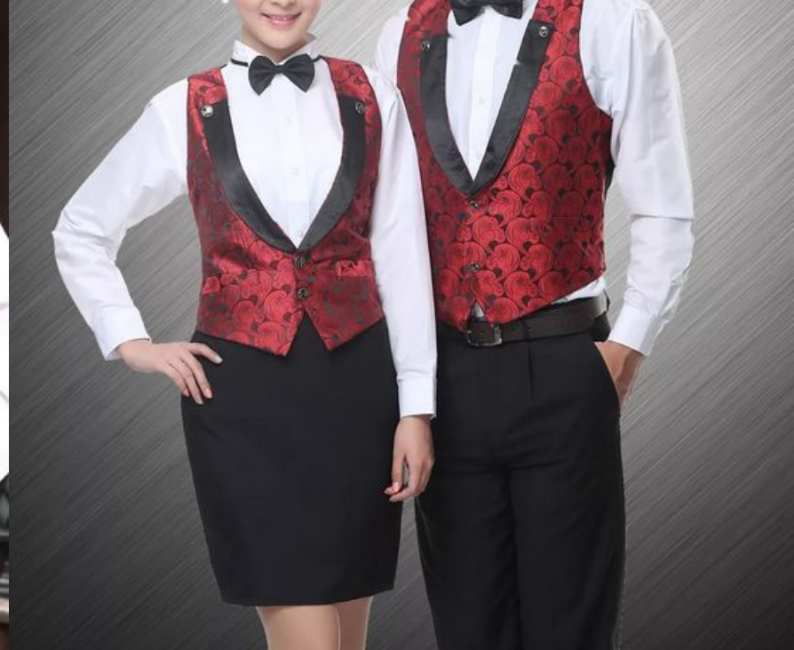
Внешний вид официантов кафе «Чак-Чак» в гостинице «ЛЭЗЗЭТ»