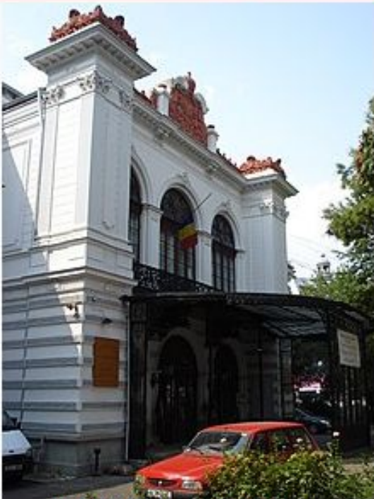
Suțu Palace, штаб-квартира музея Бухареста