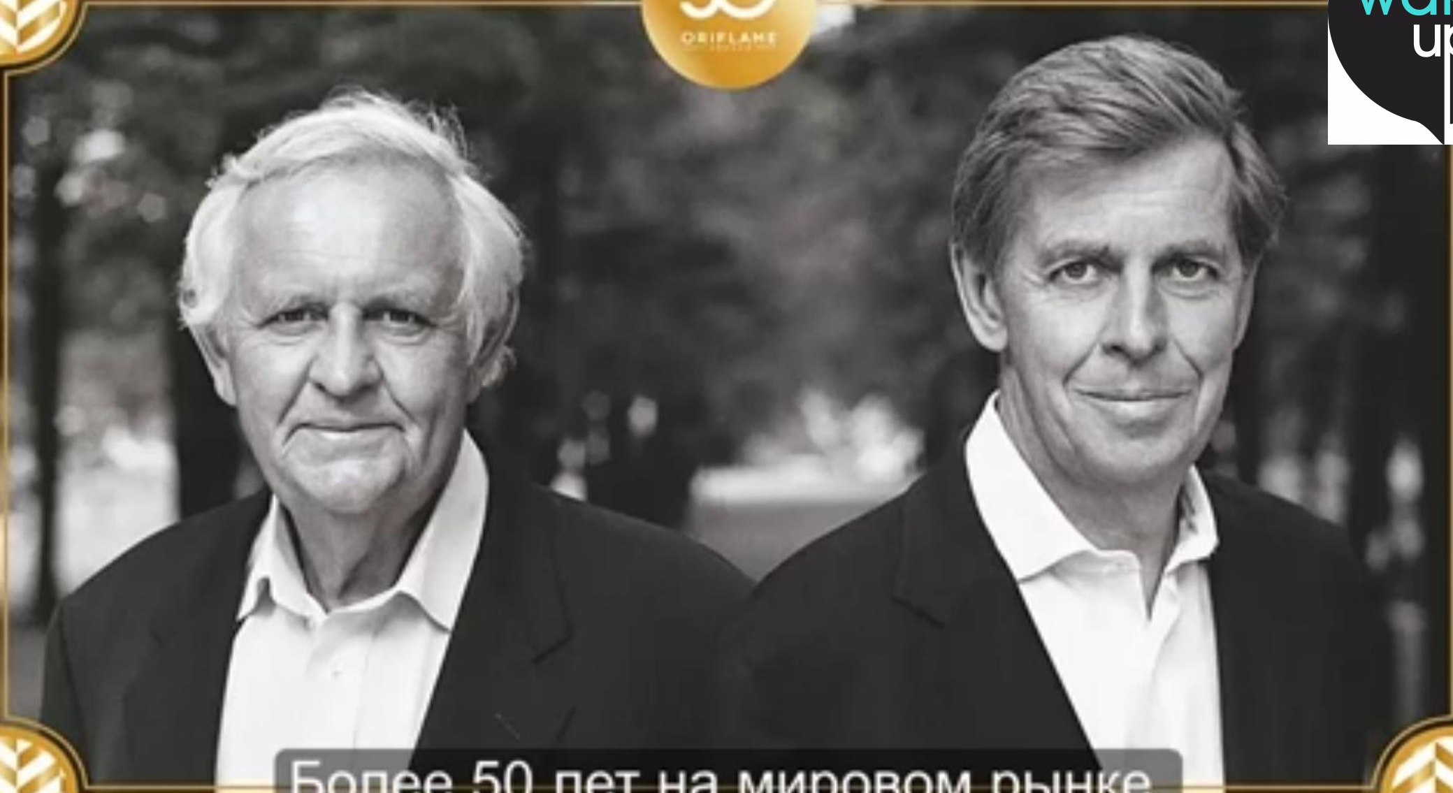
Более 50 лет на мировом рынке.