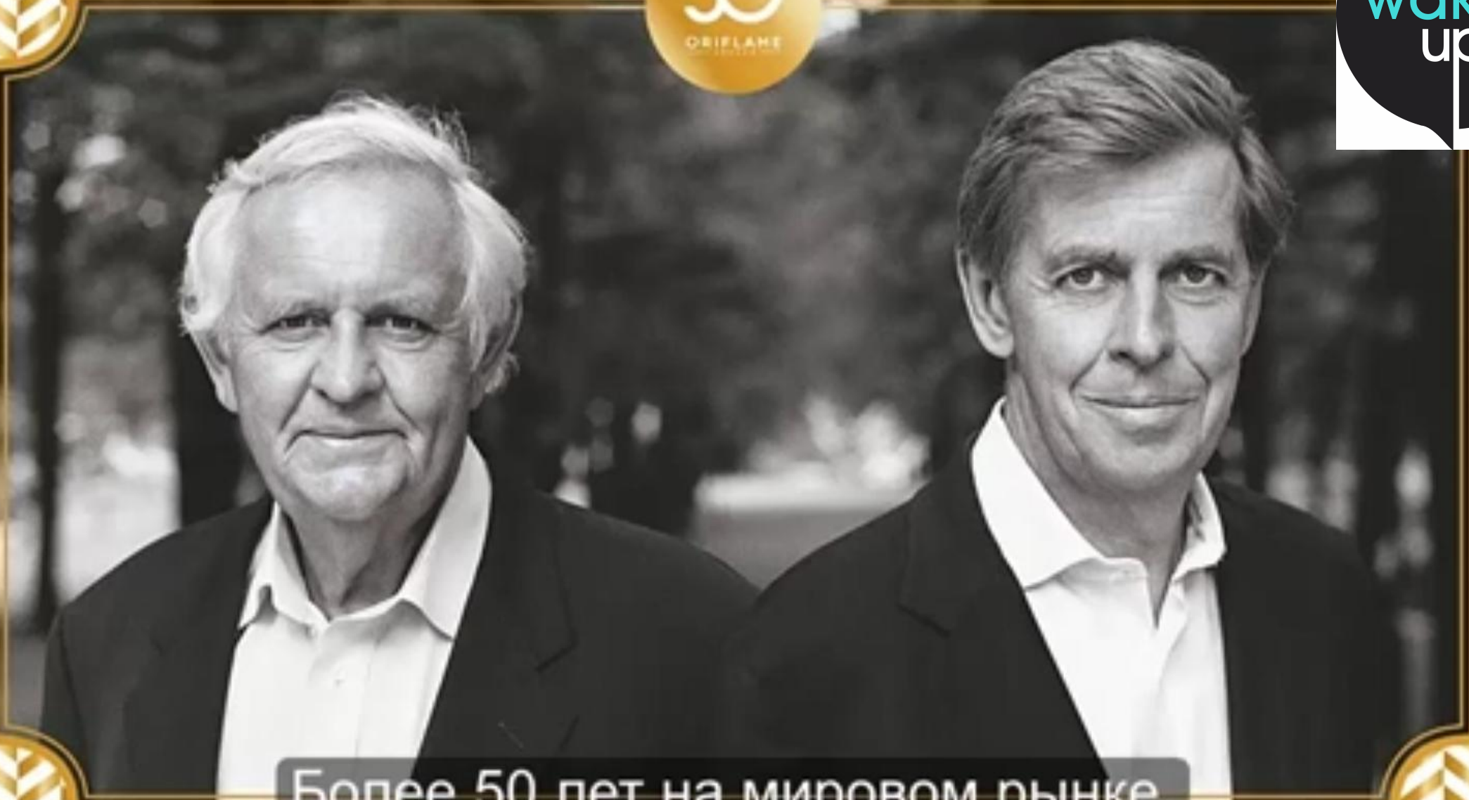
Более 50 лет на мировом рынке.