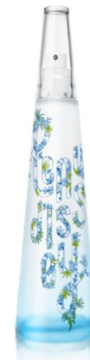
EAU D'ISSEY Туалетная вода 100ML РРЦ: 4 176 РУБ

-40% скидка от цены классического продукта