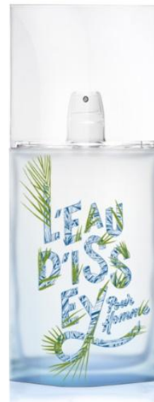
EAU D'ISSEY POUR HOMME Туалетная вода 125ML РРЦ: 4 176 РУБ

-25% скидка от цены классического продукта