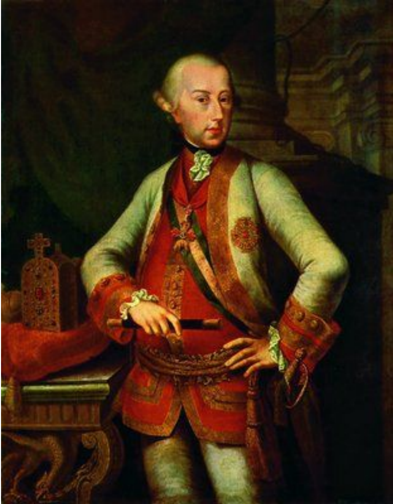
Иосиф II (1780 – 1790)