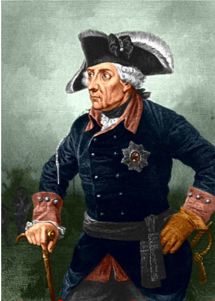
Фридрих II Великий (1740 – 1786)