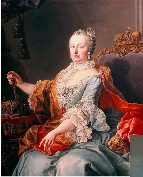
Мария-Терезия (1740 – 1780)