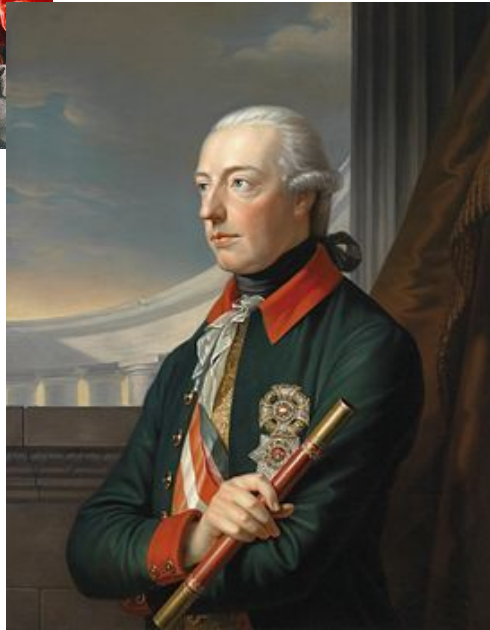
Иосиф II (1780 – 1790)

В первой половине века ценой немалых дипломатических усилий Габсбургам удалось добиться признания единого порядка престолонаследия во всех своих землях вне зависимости от того, предаётся трон по женской или мужской линии.