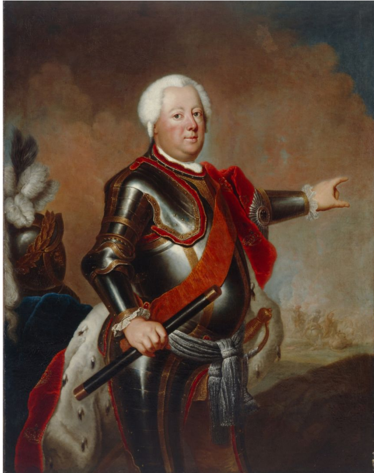
Фридрих Вильгельм I (1713 – 1740)

При Фридрихе Вильгельме I из династии Гогенцоллернов страна стремительно наращивала свою военную мощь.