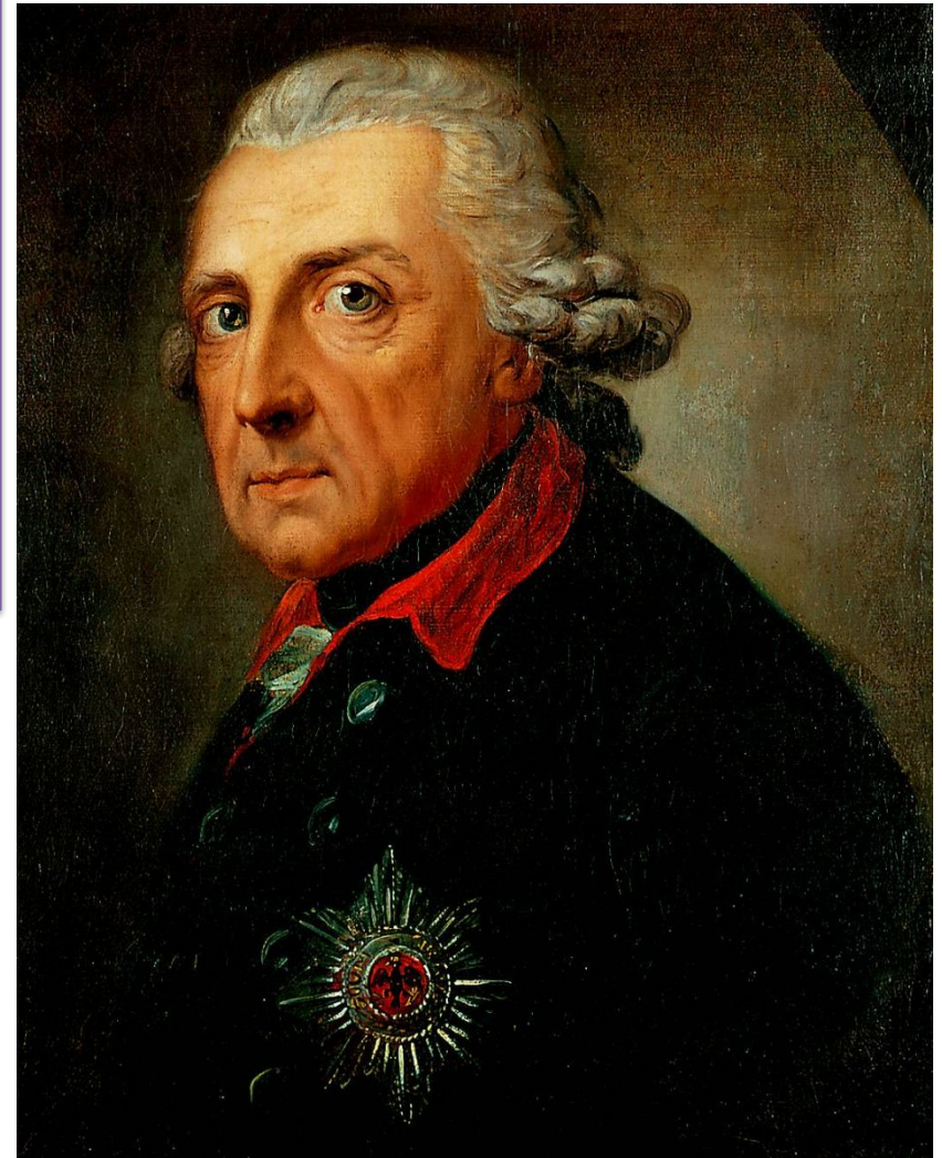
Фридрих II Великий (1740 – 1786)