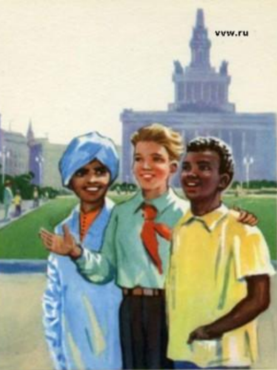
ПИОНЕР ДРУЖИТ С ДЕТЬМИ ВСЕХ СТРАН МИРА