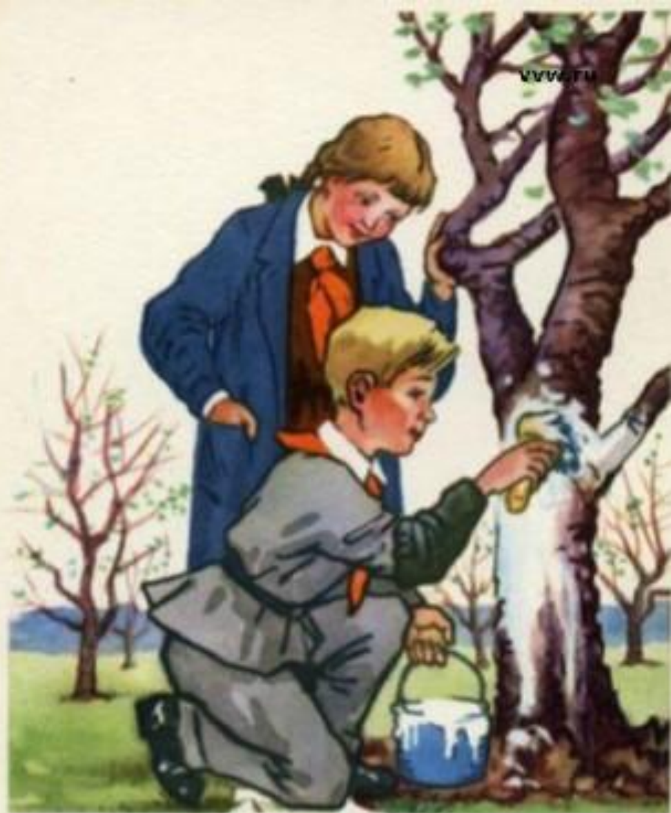
ПИОНЕР ЛЮБИТ ПРИРОДУ, ОН ЗАЩИТНИК ЗЕЛЕННЫХ НАСАЖДЕНИЙ, ПОЛЕЗНЫХ ПТИЦ И ЖИВОТНЫХ