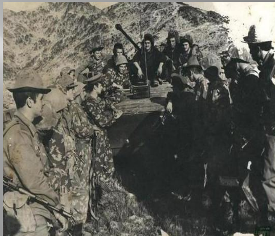
В горах Афганистана