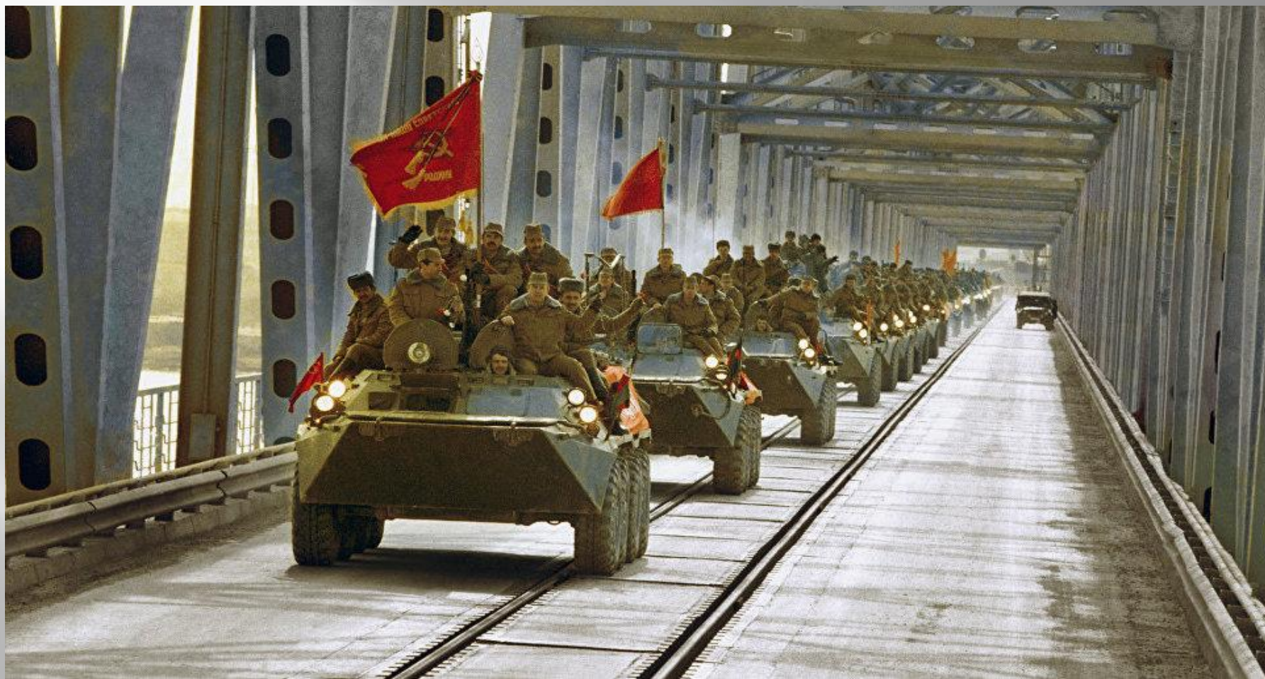
Колонна российской бронетехники проходит по мосту через реку Пяндж

4-й этап: январь 1987 - февраль 1989 года. Помощь афганскому руководству в проведении политики национального примирения. Продолжение поддержки боевых действий, проводимых правительственными войсками. Подготовка к выводу советских войск.