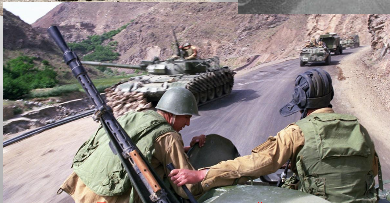
Первые дни ввода войск