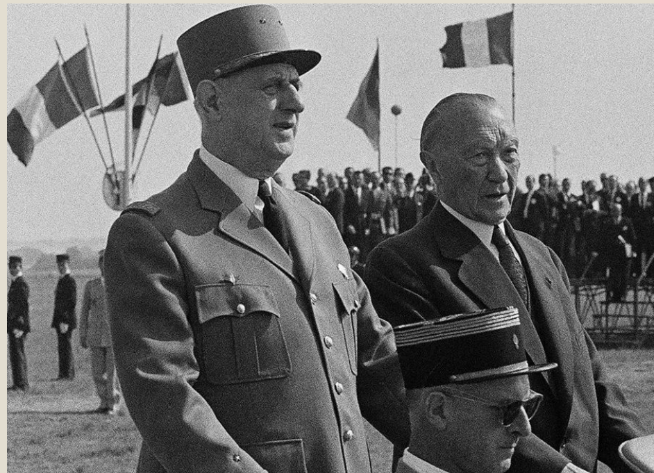
Де Голль и Аденауэр