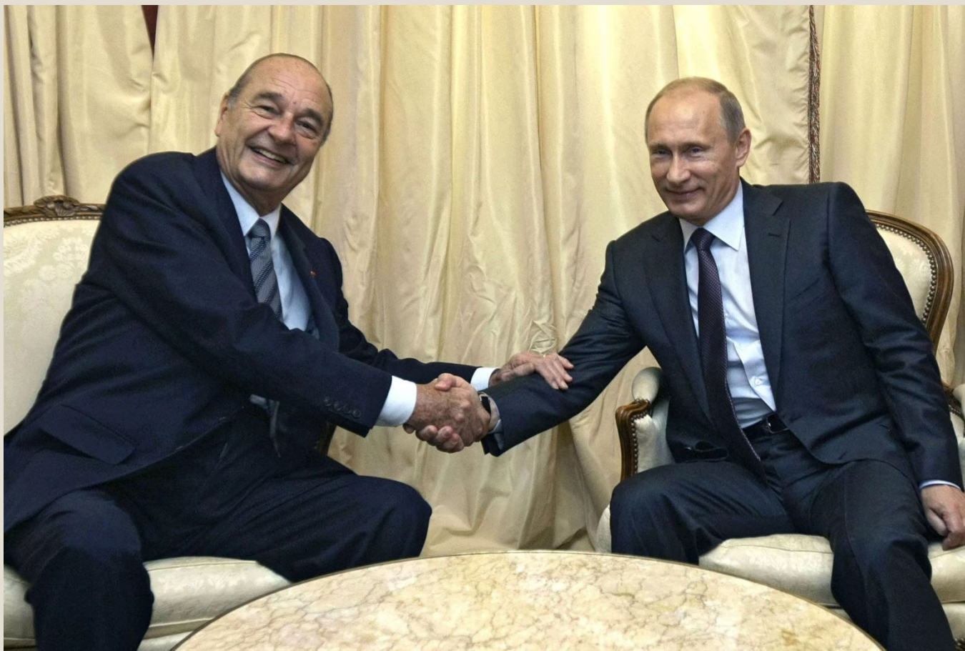
Жак Ширак и Владимир Путин