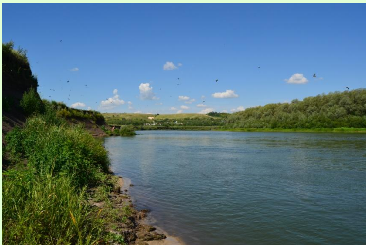
Дон в Хохольском районе