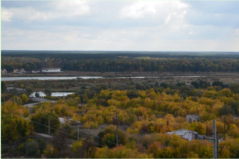
Река Воронеж в Рамони

Воронеж – левый приток Дона. Начинается он в месте слияния рек Лесной Воронеж и Польной Воронеж в Тамбовской области. Течёт с севера на юг.