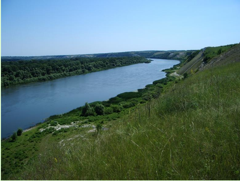
Долина реки Дон в Верхнемамонском районе