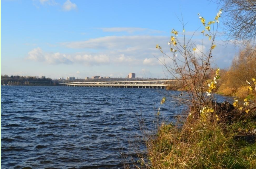
Воронежское водохранилище. Вид на Северный мост