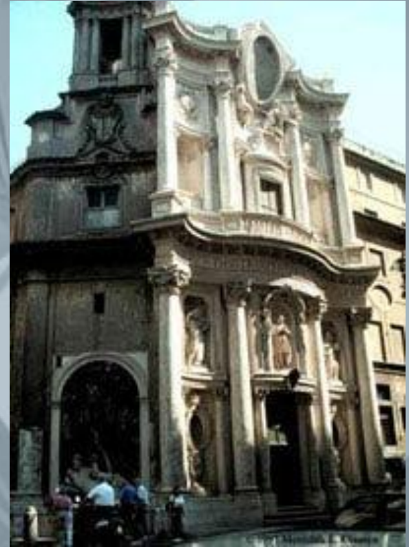
Церковь Сан Карло алле Кватро Фонтане, Рим