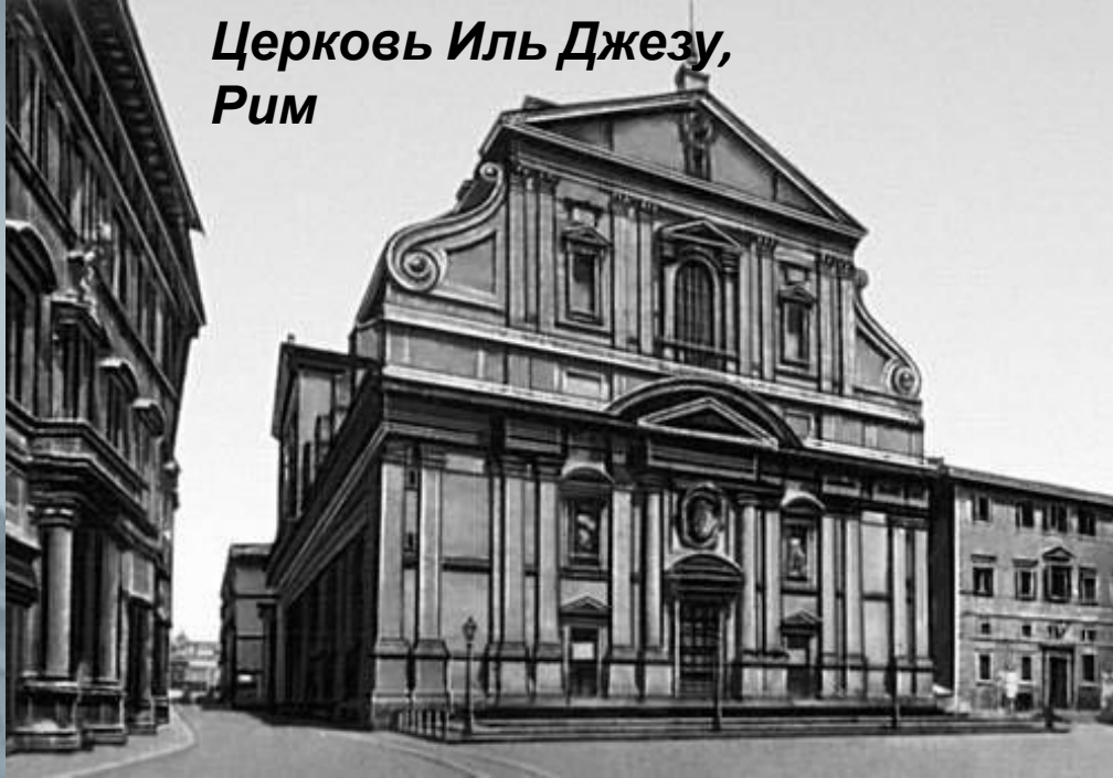
Церковь Иль Джезу, Рим