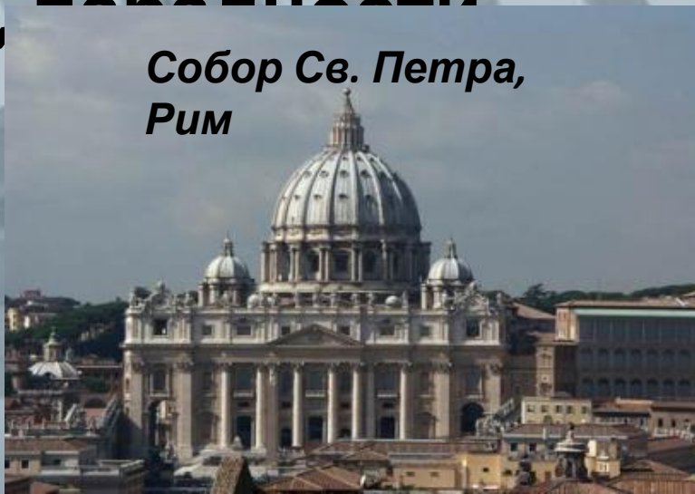
Собор Св. Петра, Рим