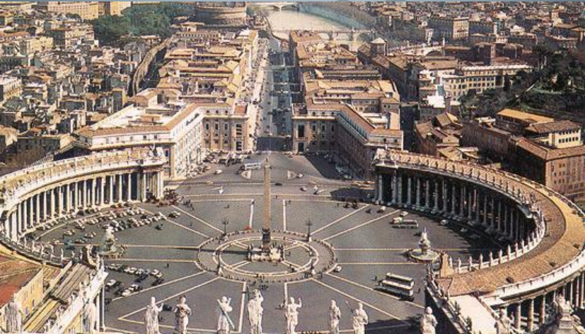
Площадь св.Петра в Риме. 1656-1667