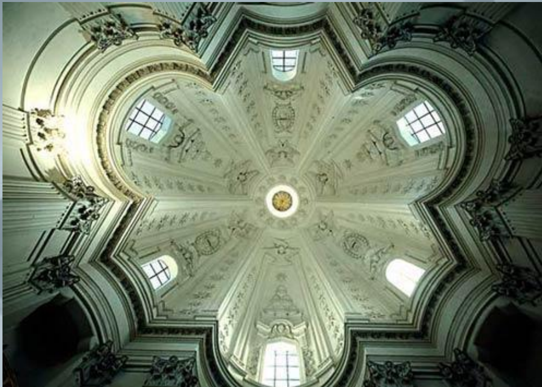
Церковь Сант-Иво алла Сапиенца, Рим

Искусство барокко отличается экзальтацией образов; ему свойственны контрастность, напряженность, динамичность образов, стремление к совмещению реальности и иллюзии.