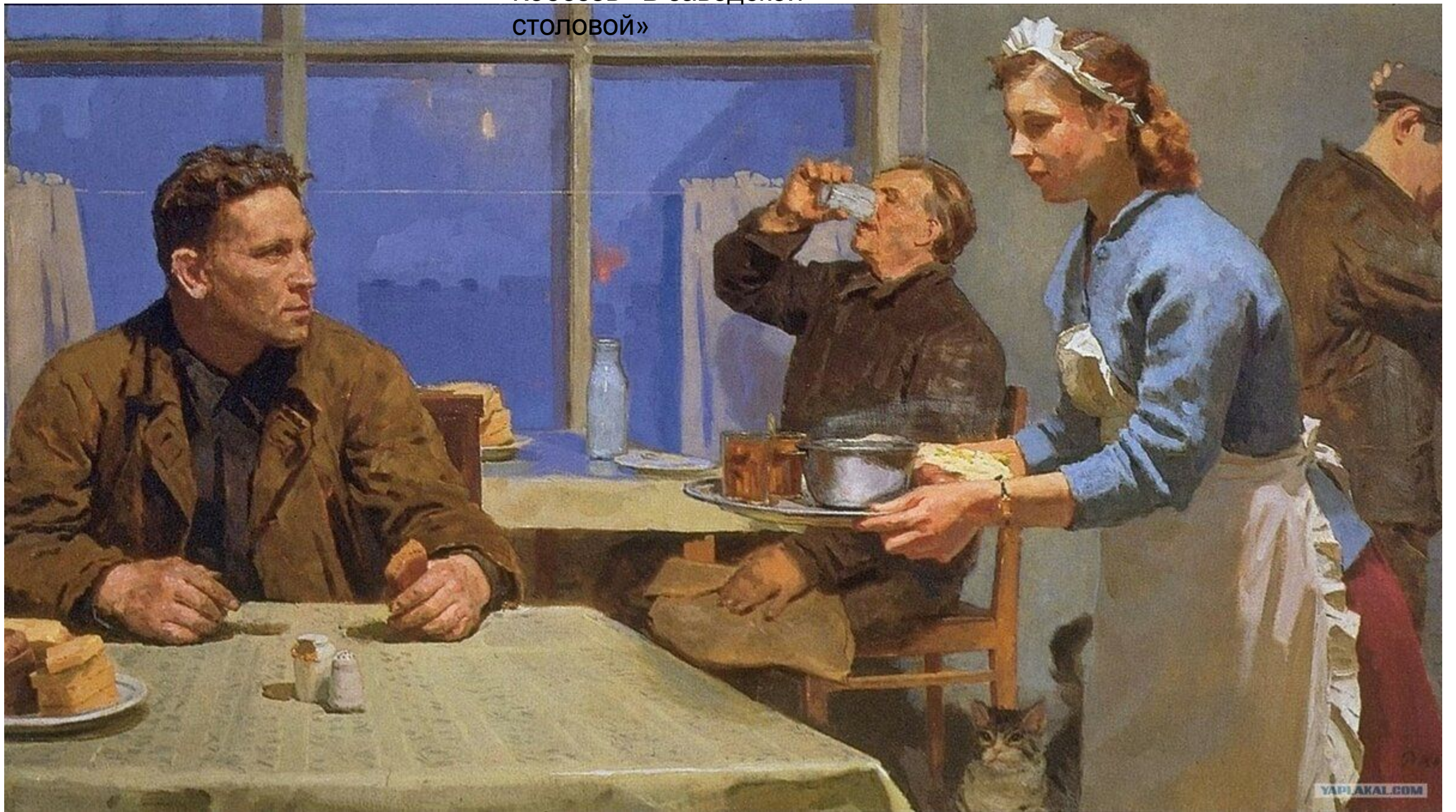
Кобозев «В заводской столовой»