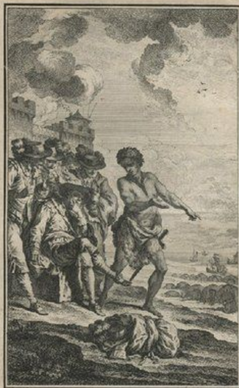
Il retourne chez les Égaux. Voyez la Note à p. 155