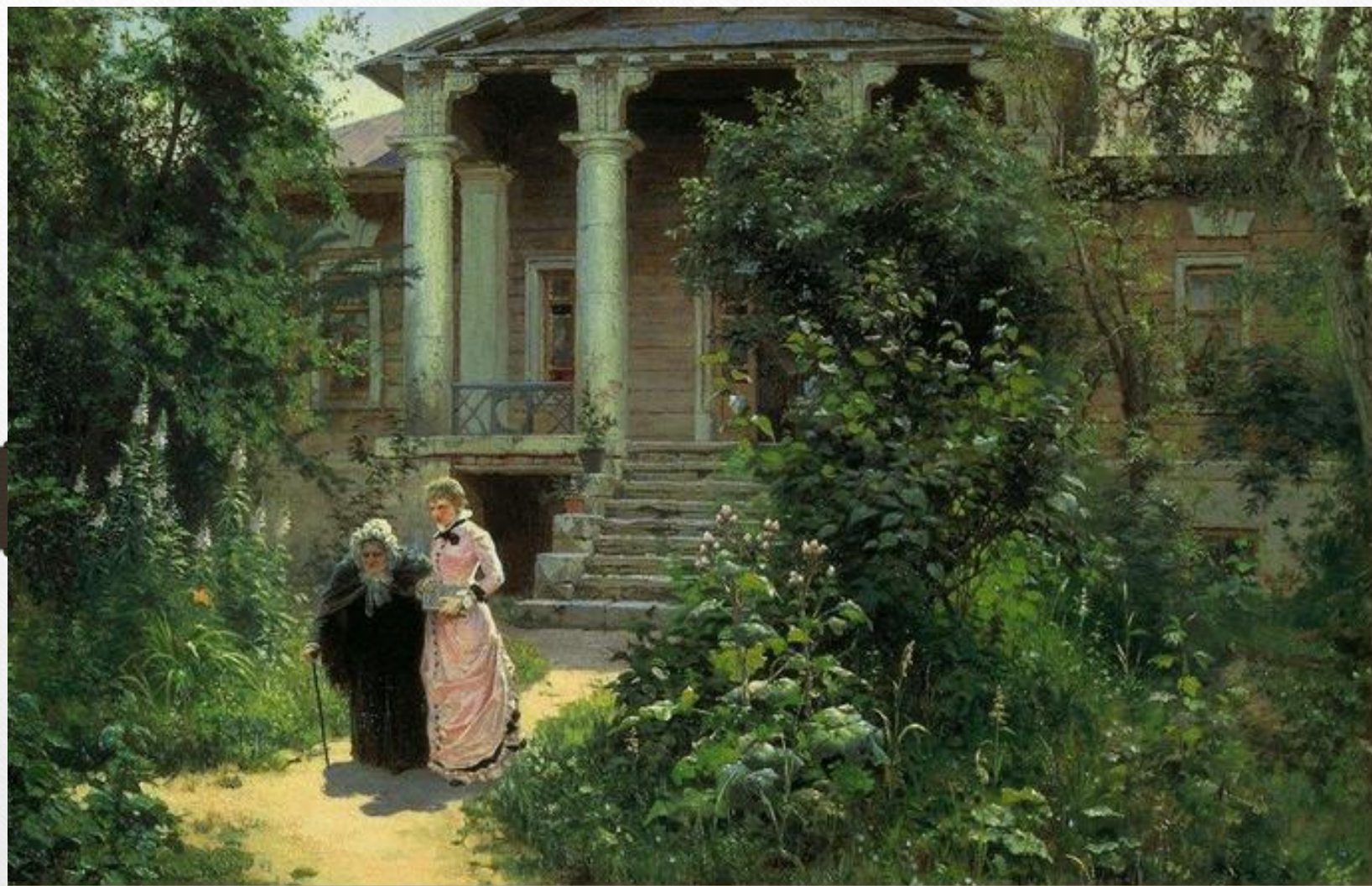
В. Д. Polenov. Бабушкин сад. 1878.