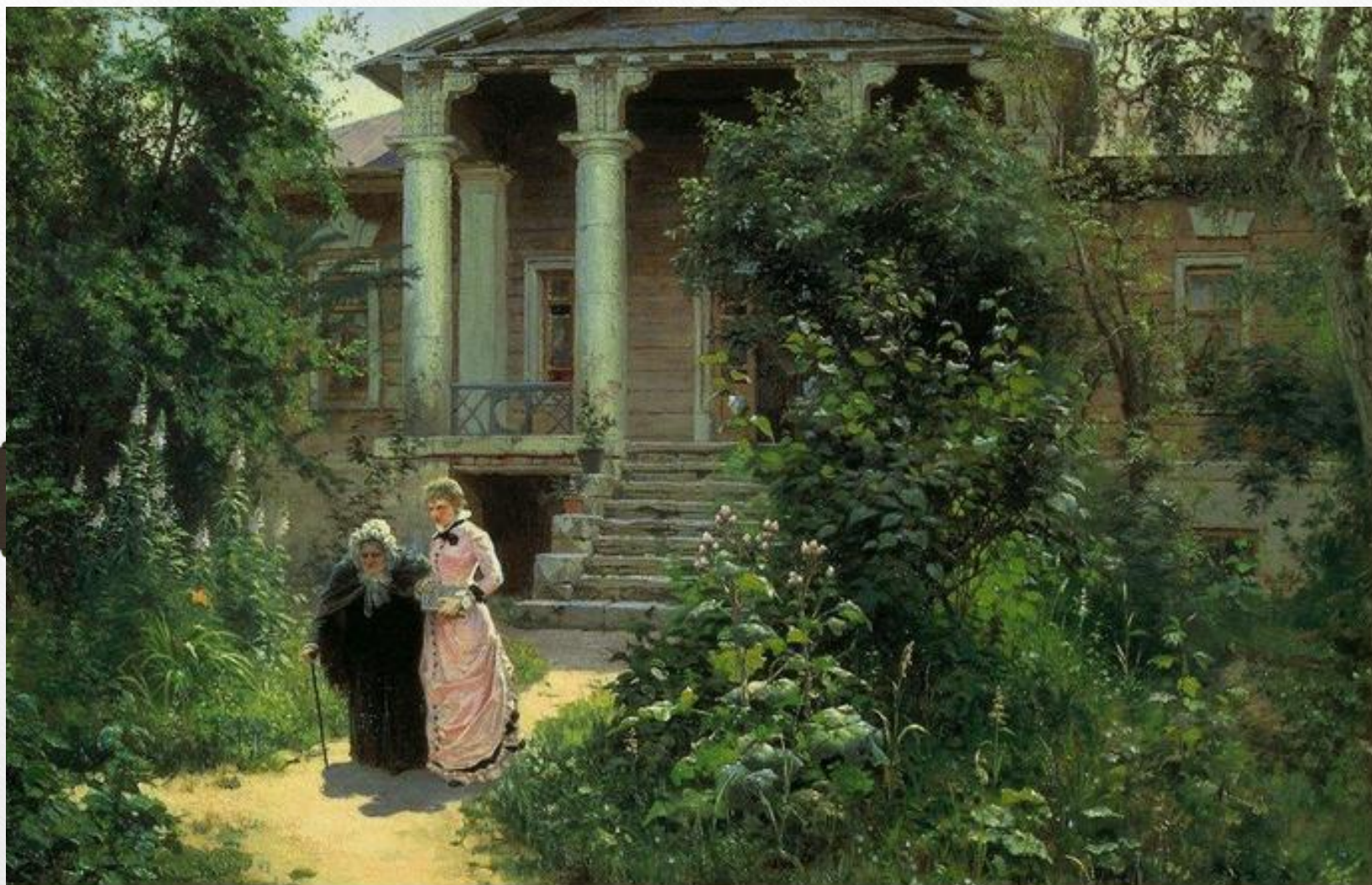
В. Д. Polenov. Бабушкин сад. 1878.