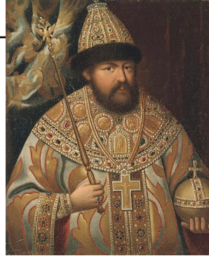
Романов Алексей Михайлович – Раҫсей патши