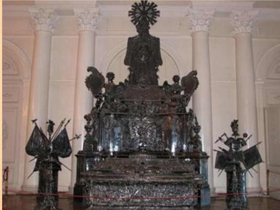
Гробница А. Невского в С.- Петербурге

важная страница не только истории Псковского края, но и государства Российского. Память о нем трепетно хранится и объединяет множество людей. В 2008 году Александра