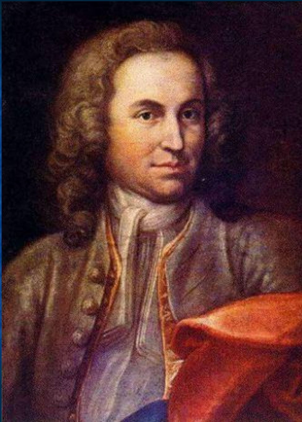
ИОГАНН СЕБАСТЬЯН БАХ (1685-1750)