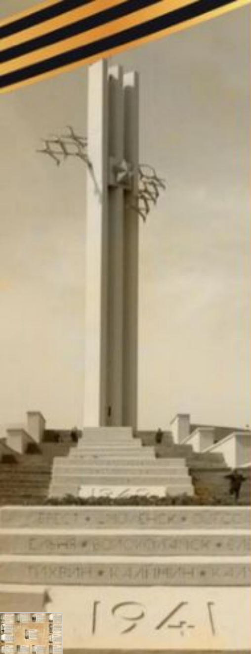
Горд герой Смоленск. Курган Бессмертия