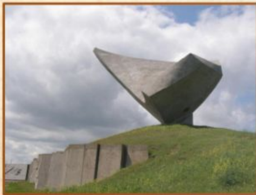
Парус - Памятник Эльтигенскому десанту