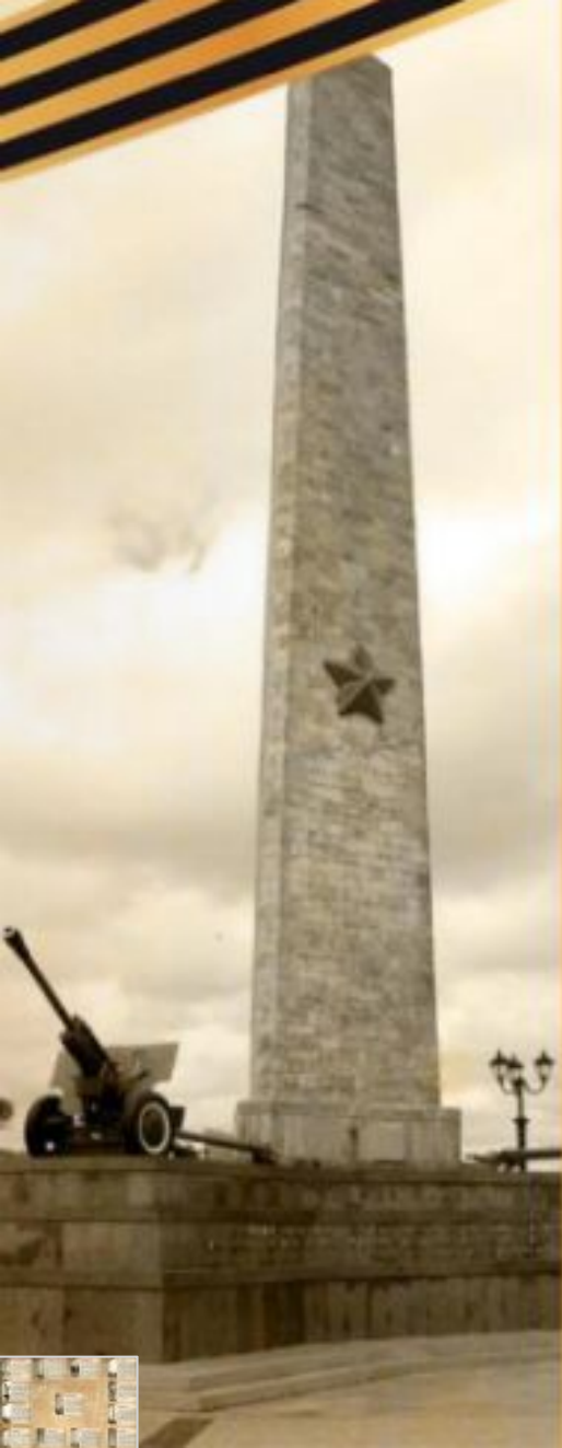
Композиция над музеем обороны Аджимушкайских каменоломен