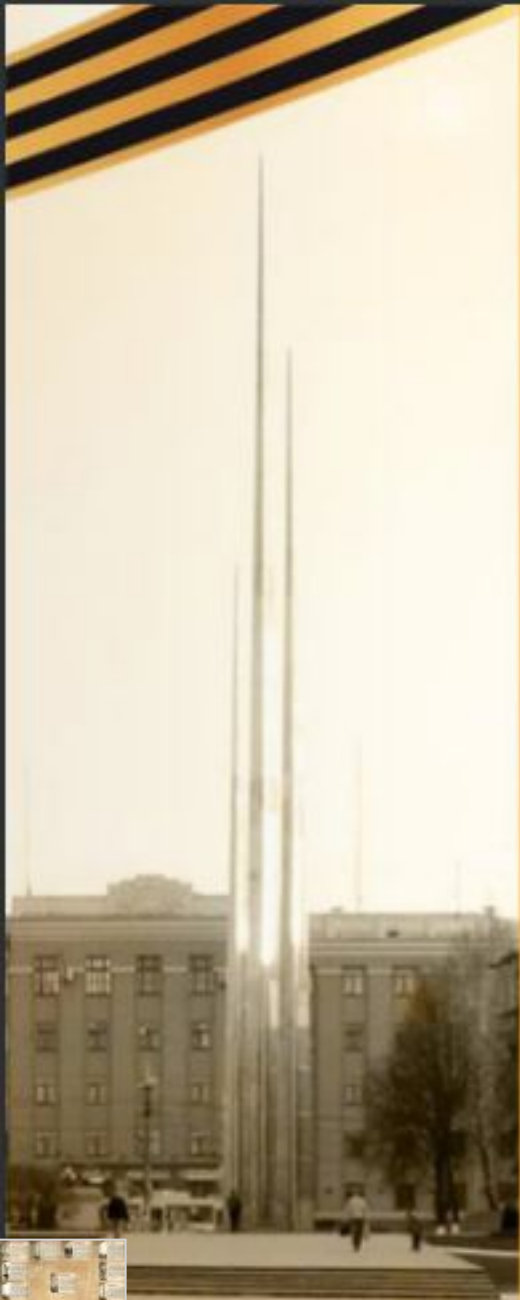
Мемориал - героям- пролетарцам