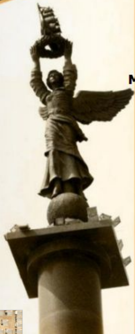
Мемориальный комплекс «Рубеж обороны»