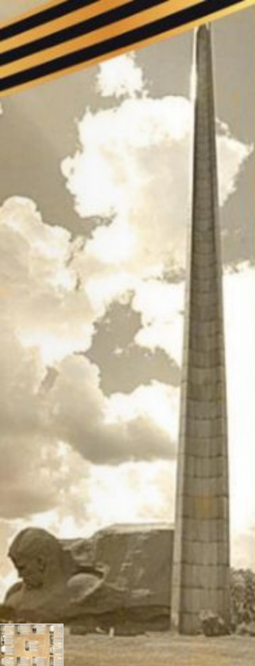
Скульптурная композиция «Жажда»