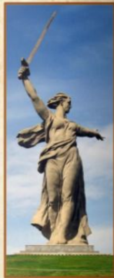
Монумент «Родина-мать зовет»