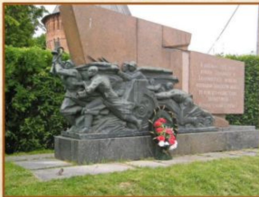
Мемориальный знак в честь освобождения Смоленщины