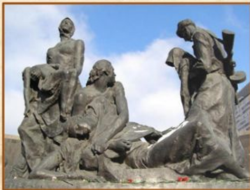
Скульптурная композиция «Блокада»