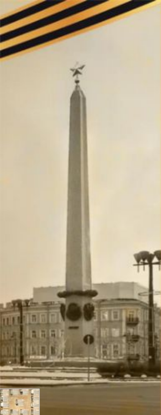
Мемориал героическим защитникам Ленинграда