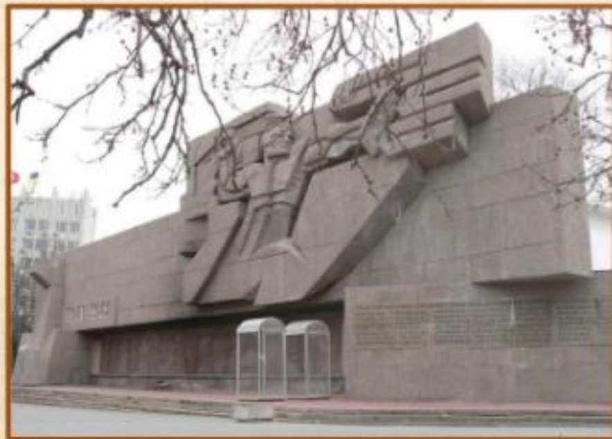
Мемориал героев обороны Севастополя 1941 - 1942 гг.