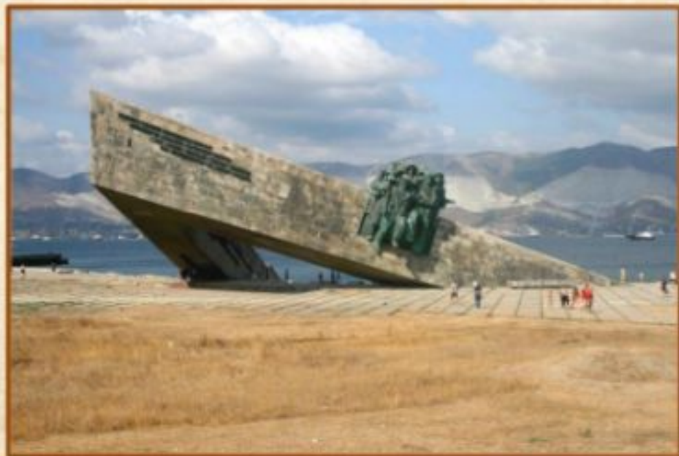
Мемориал «Малая земля»