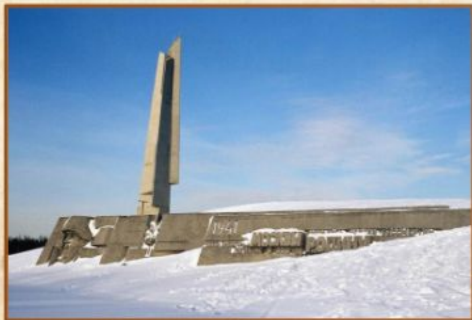
Монумент «Защитникам Москвы»