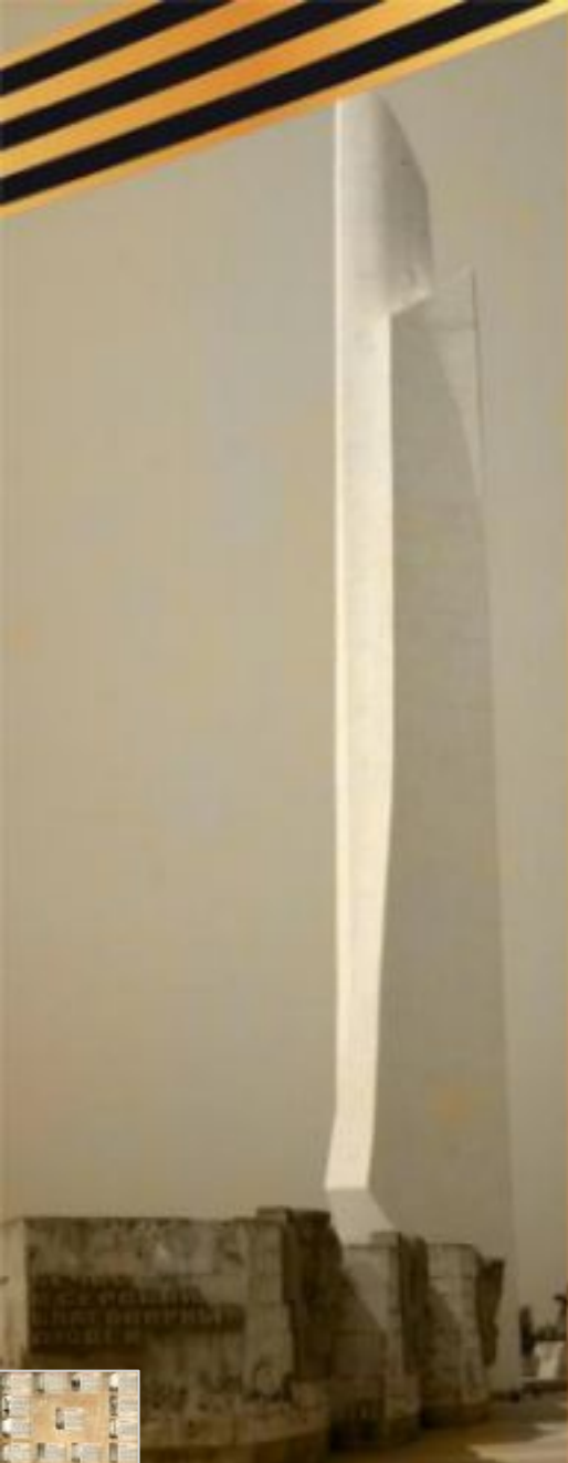
Обелиск Славы на Сапун-горе