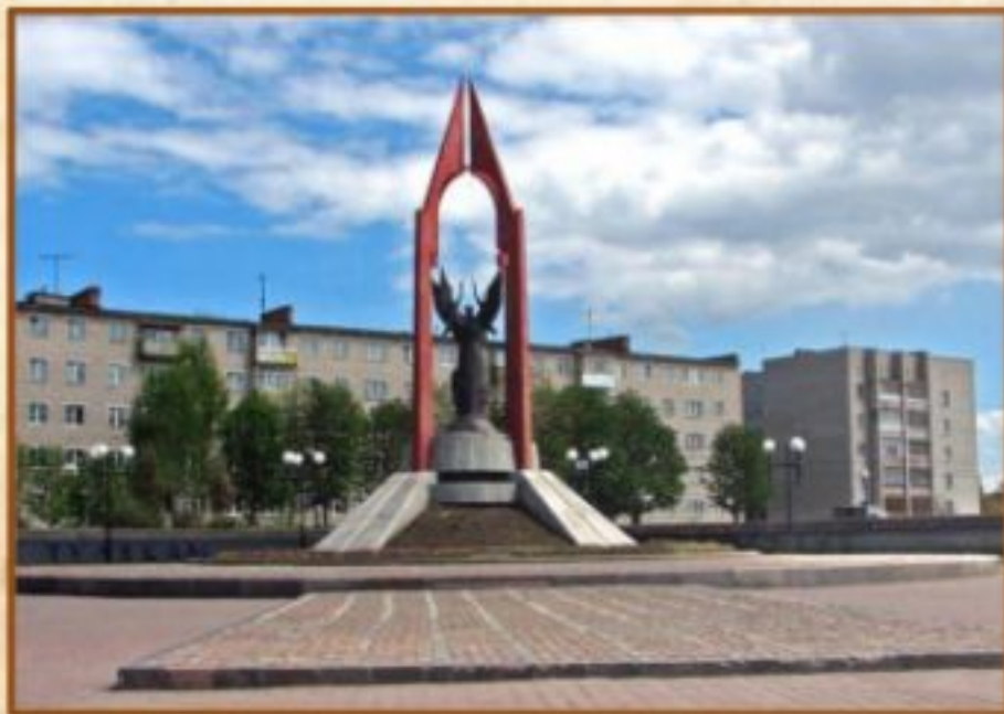
Мемориал погибшим в годы войны 1941 – 1945 гг.