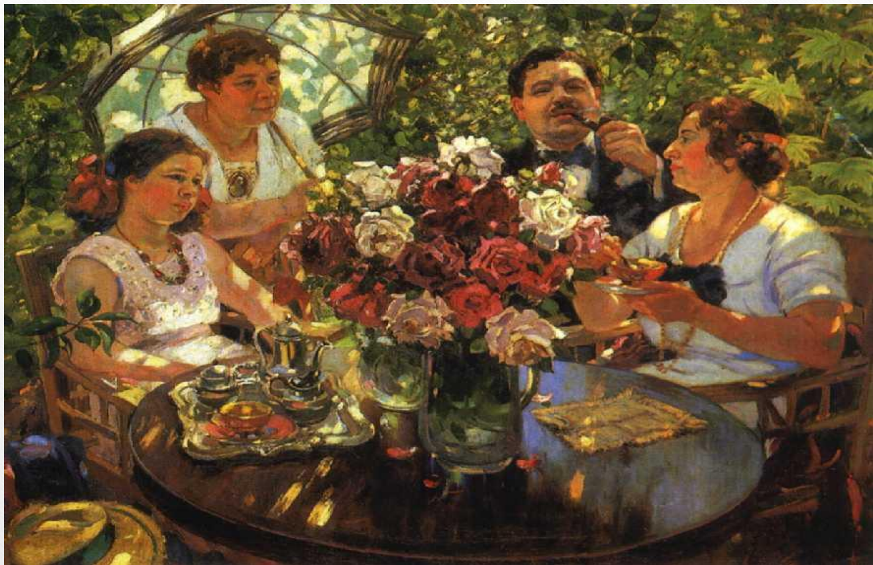
Семейный портрет. 1934 г.