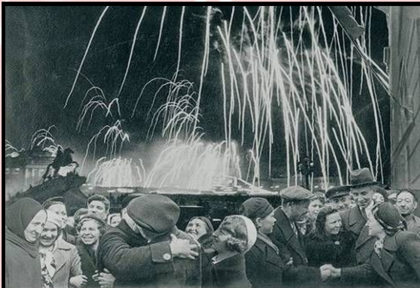
-Великая победа одержана советскими войсками под Ленинградом:

Победе радовалась вся страна, но эта радость была со слезами на глазах, так как в каждой семье, в каждом доме кто-то погиб на этой страшной войне.