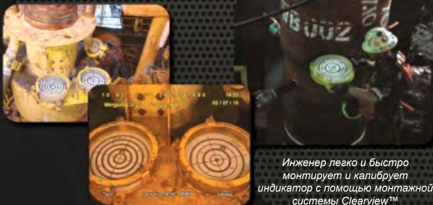
Снимки индикаторов Bullseye с камеры ТНПА

Инженер легко и быстро монтирует и калибрует индикатор с помощью монтажной системы Clearview™