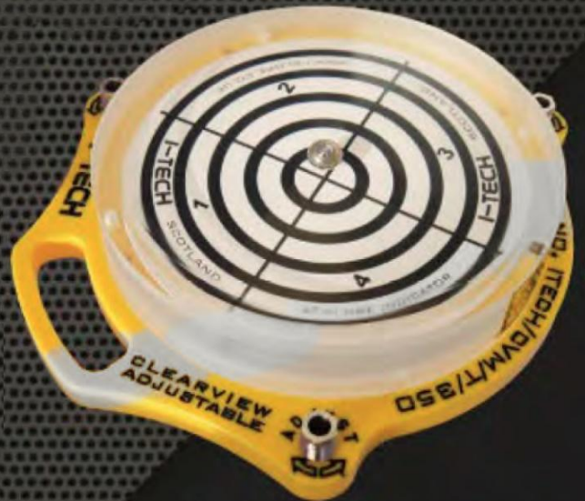
Индикатор Bullseye производства I-TECH, диаметр шкалы 350 мм, диапазон измерений 5°, на базе монтажной системы Clearview™ Top Mount – для горизонтальных монтажных поверхностей