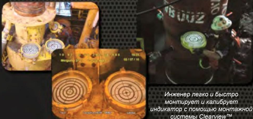
Снимки индикаторов Bullseye с камер ТНПА

Инженер легко и быстро монтирует и калибрует индикатор с помощью монтажной системы Clearview™