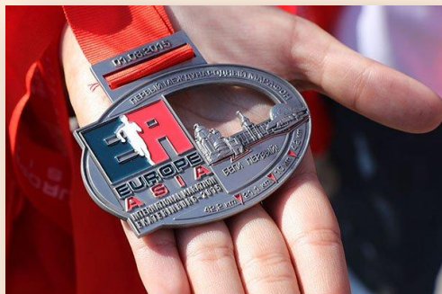
Международный марафон Европа-Азия 2015