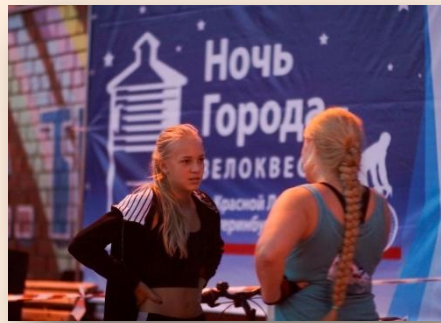
Ночь города велоквест