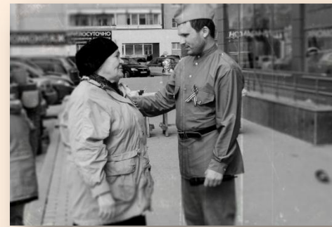
70-летие Победы ТРЦ Гранат