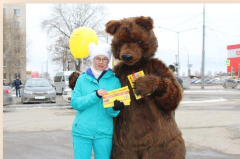
Открытие сети магазинов «Мир Обуви и одежды»