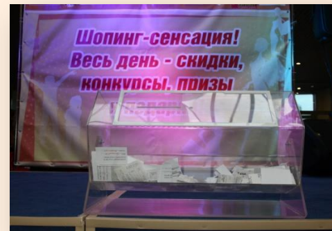
День Распродаж ТРК КомсоМОЛЛ