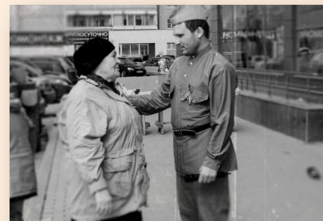
70-летие Победы ТРЦ Гранат