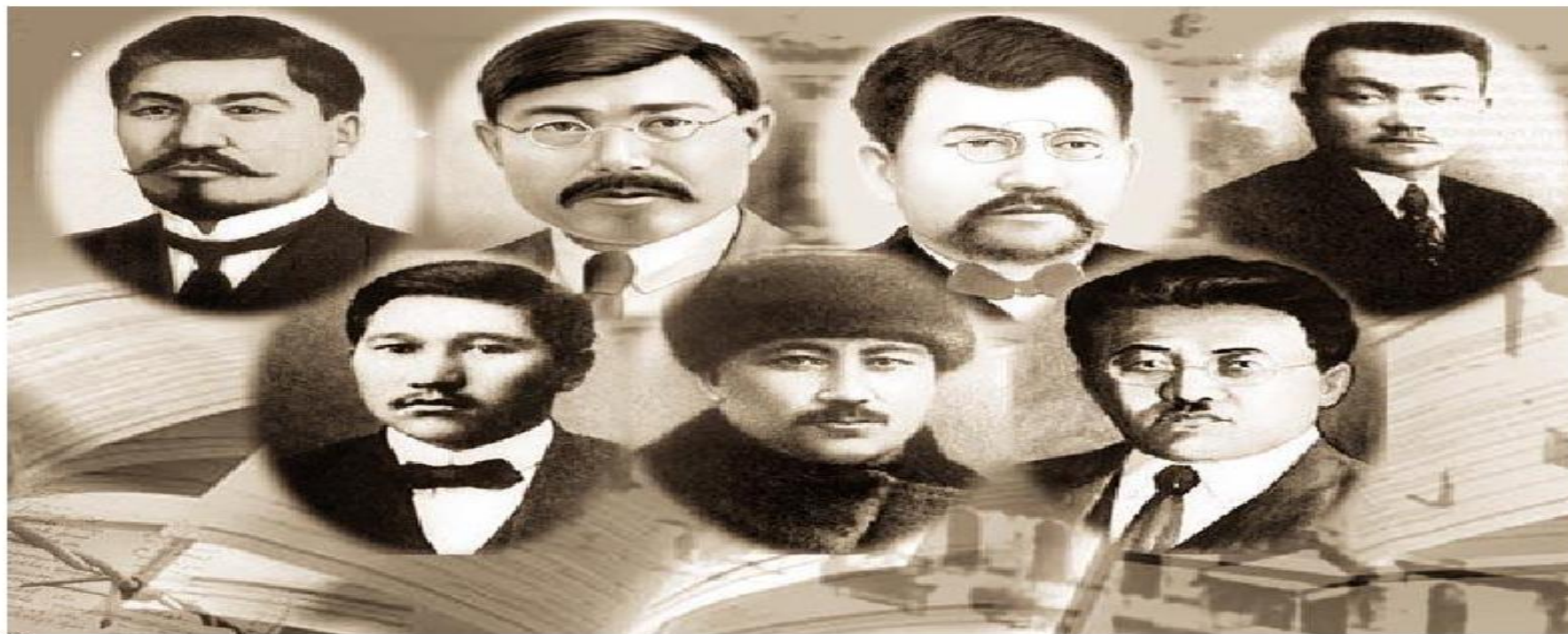
Лидеры партии «Алаш»

Почему партия «Алаш» получила всенародную поддержку?