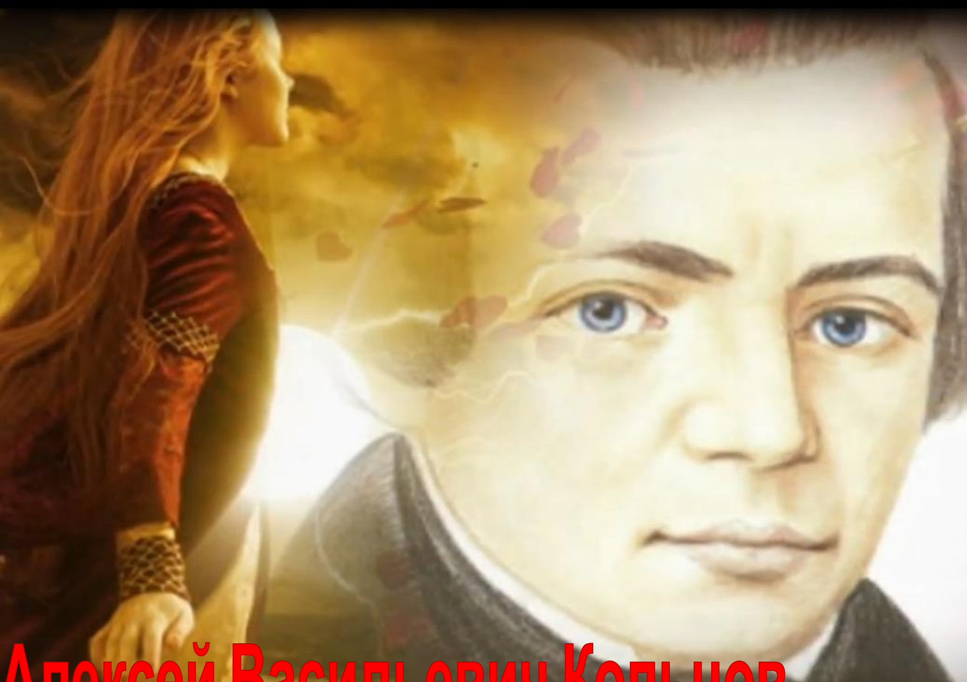
Алексей Васильевич Кольцов