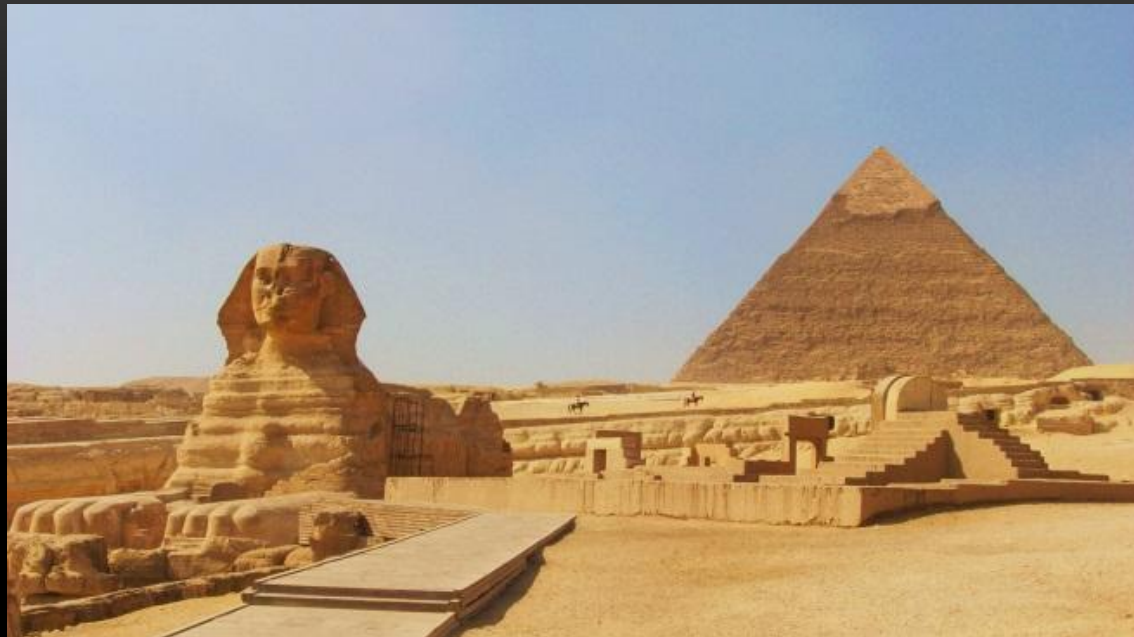
Пирамида сыну Хеопса, Хифрена

Египтяне очень заботились о сохранении тела умершего, в которое вновь могла бы вселиться его душа. Тело обматывали тонкими бинтами-изготавливали мумию. Её клали в гроб- саркофаг, на котором писали заклинания и изображения богов, гробница, где стоял саркофаг, считалась домом покойного. Для фараонов строились пирамиды или гробницы высеченные в камне. В неё укладывались личные вещи умершего и изобилие пищи.