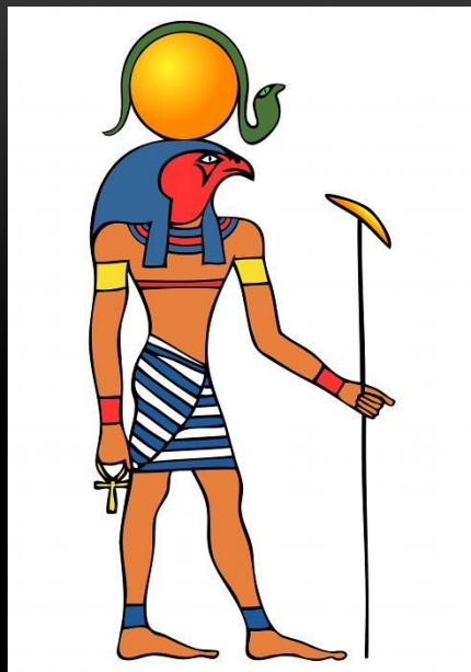
Бог Солнца- Амон-Ра

Египтяне изображали бога земли-Геб в виде человека с головой змеи, а богиню неба-Нут представляли огромной коровой.