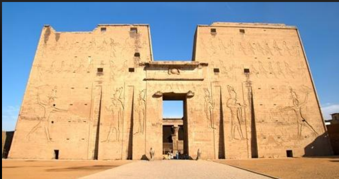
Храм Хора, посвященный богу неба и солнца- Хору

Египтяне верили, если они не угодят богам- те разгневаются и навлекут беду. Поэтому их, молили о пощаде. Для богов строили храмы. Египтяне изготавливали статуи , фигуры божеств, они полагали , будто Бог вселяется в изображение . Считалось , что жрец лучше всех умеет общаться с богом. Он совершал священные обряды. Фараоны преподносили различные подарки , они делались богам, будто бы обитавшим в храмах.