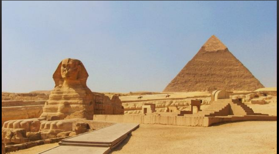
Пирамида сыну Хеопса, Хифрена

Египтяне очень заботились о сохранении тела умершего, в которое вновь могла бы вселиться его душа. Тело обматывали тонкими бинтами-изготавливали мумию. Её клали в гроб- саркофаг, на котором писали заклинания и изображения богов, гробница, где стоял саркофаг, считалась домом покойного. Для фараонов строились пирамиды или гробницы высеченные в камне. В неё укладывались личные вещи умершего и изобилие пищи.