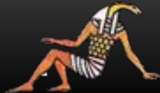
Бог земли- Геб