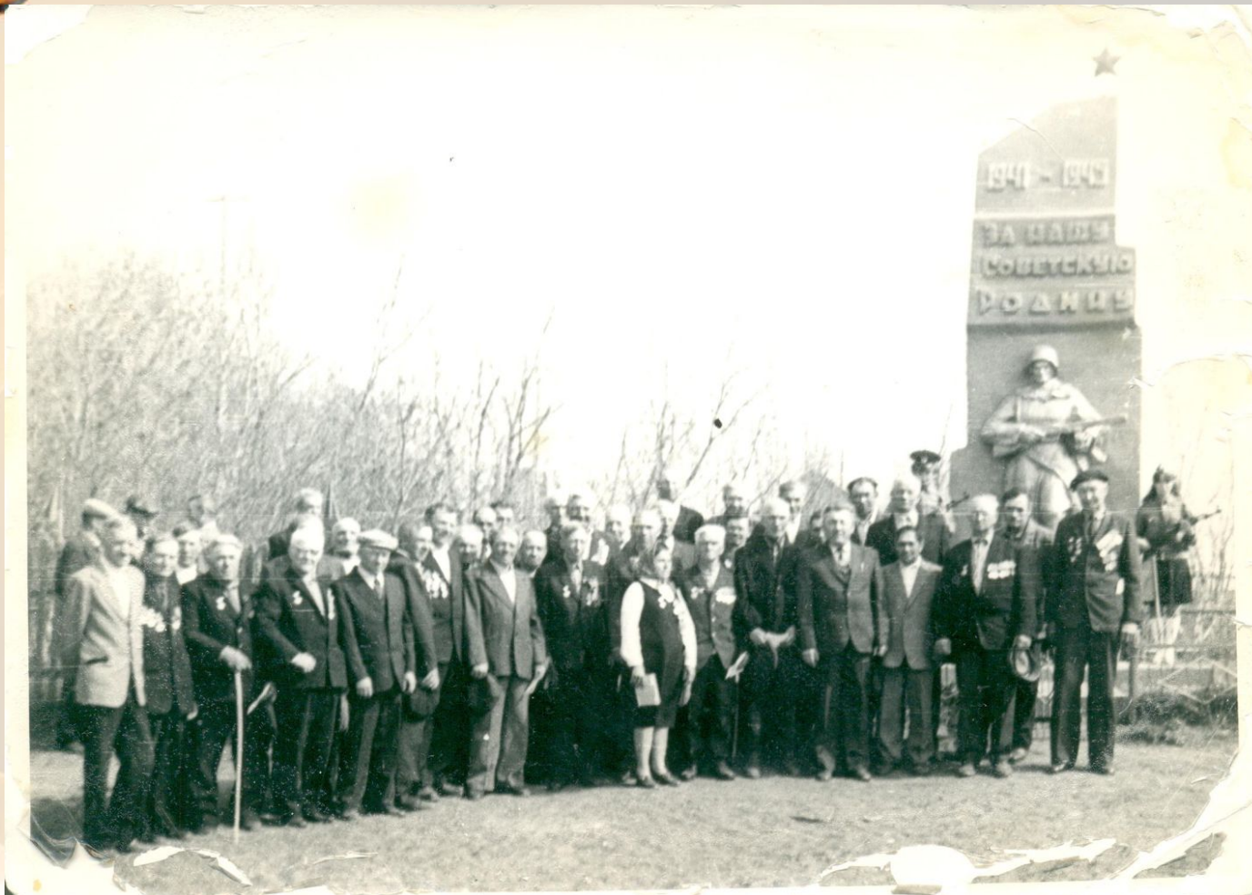
СЕЛО ЗАЛЕСОВО, ДЕНЬ ПОБЕДЫ, 1985 ГОД.