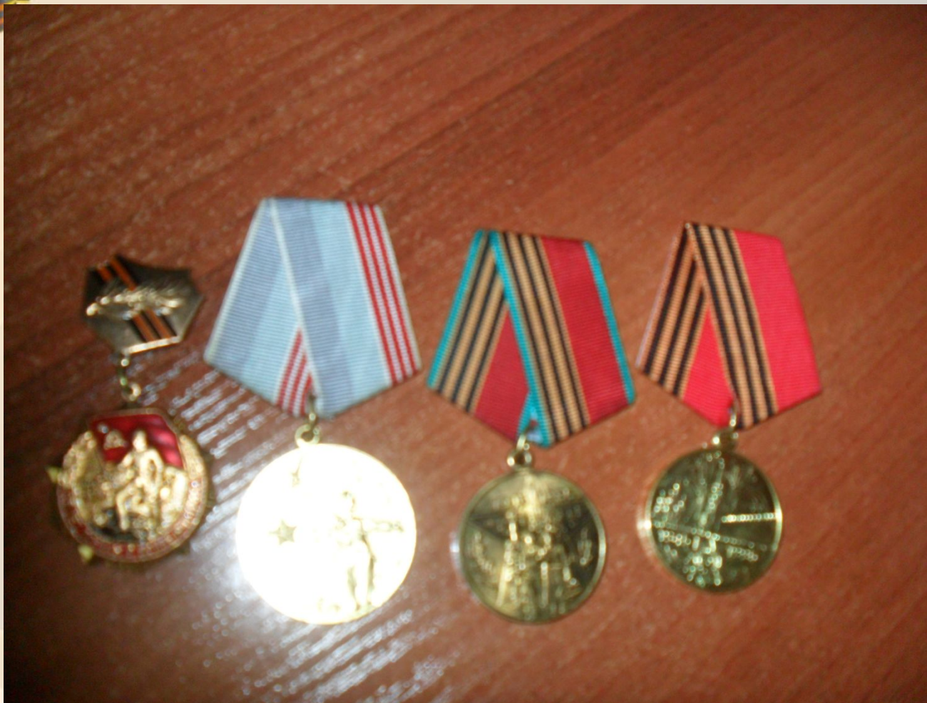
Юбилейные медали в честь 25-летия, 30-летия, 40-летия и 50-летия Победы в Великой Отечественной войне