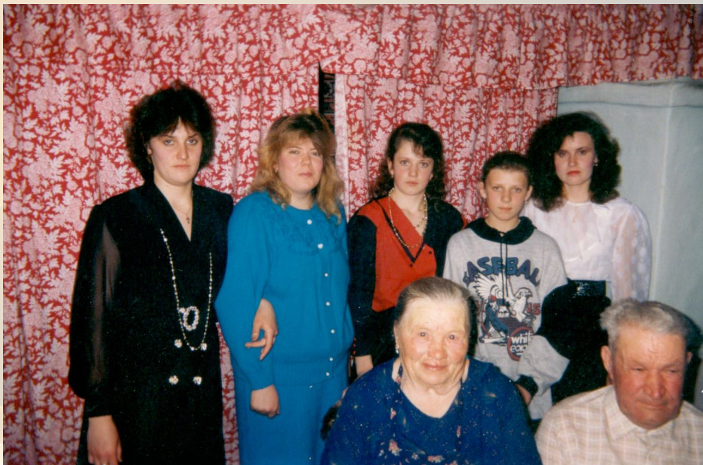
ПРАДЕДУШКА С ВНУКАМИ, 11 АПРЕЛЯ 1995 ГОДА.