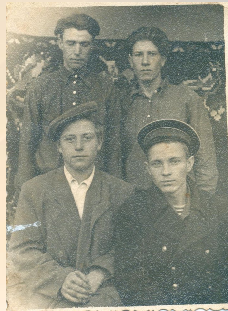
ПРАДЕДУШКА С РОДСТВЕННИКАМИ