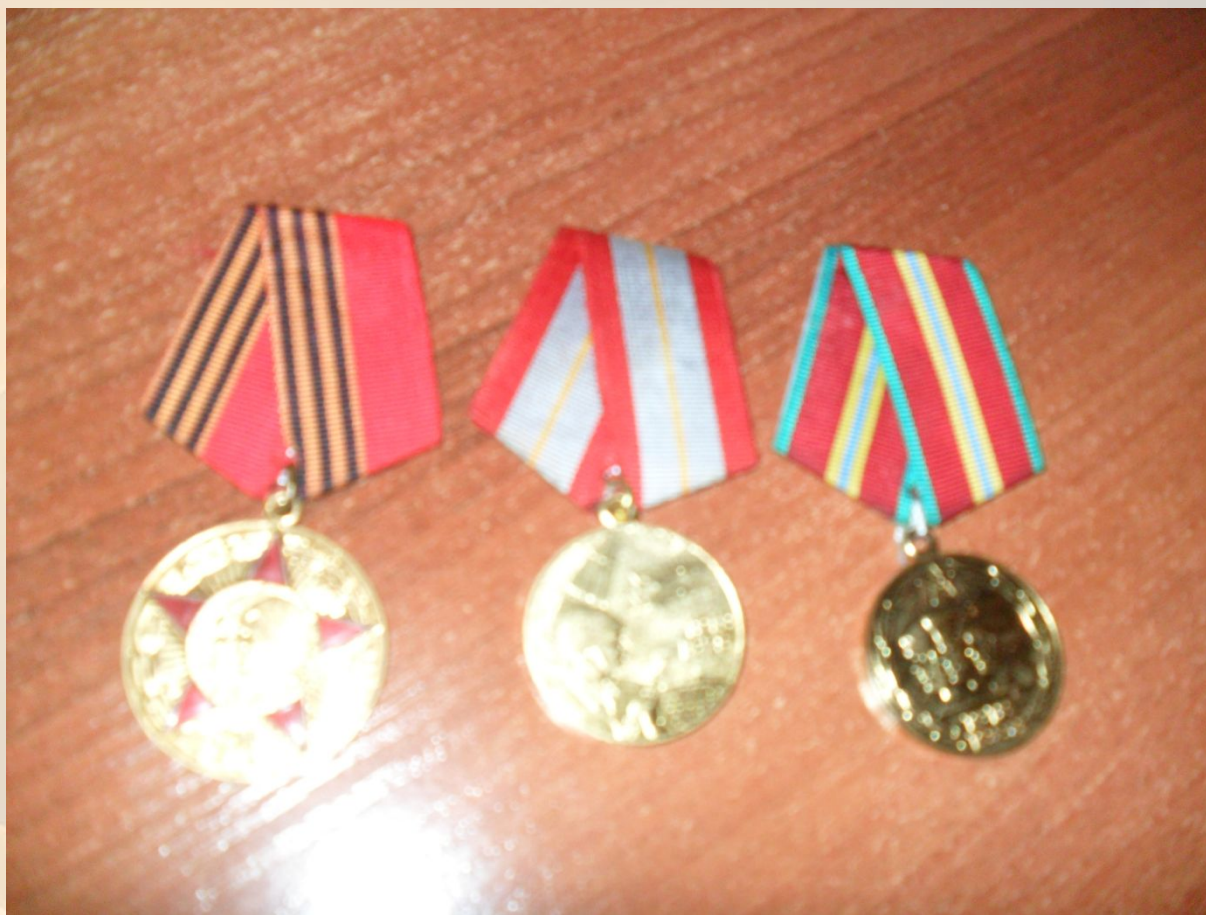
Юбилейные медали в честь 50-летия, 60-летия и 70-летия Вооруженных Сил СССР