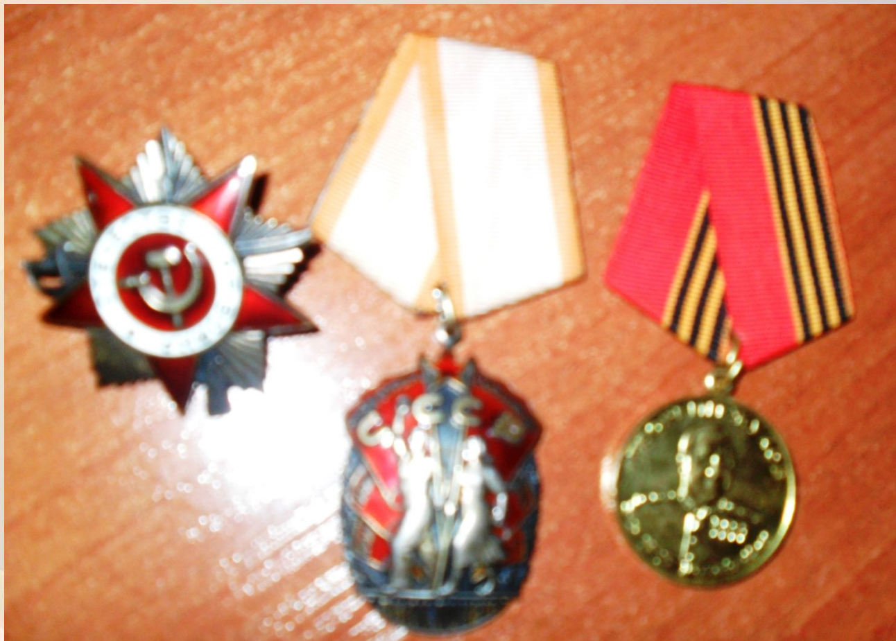
Ордена Отечественной войны и Знак Почета, медаль имени маршала Георгия Жукова