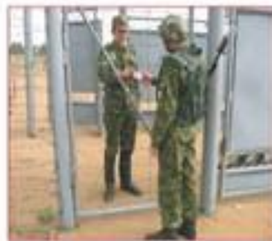
Принимать от кого-либо или передавать кому-либо предметы