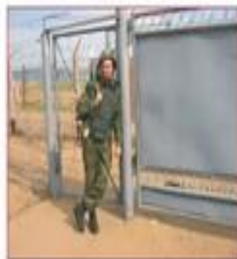
Прислоняться к чему-либо