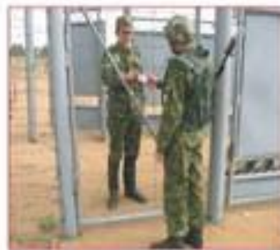
Принимать от кого-либо или передавать кому-либо предметы