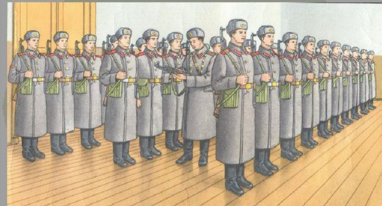
Осмотр оружия, готовность караула к несению службы