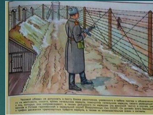
Часовой обязан не допускать к посту ближе расстояния, указанного в таблице постах и обозначенного на местности указателями запретной границы, никого, кроме начальника караула, помощника начальника караула, своего разводящего и лиц, которых они сопровождают;