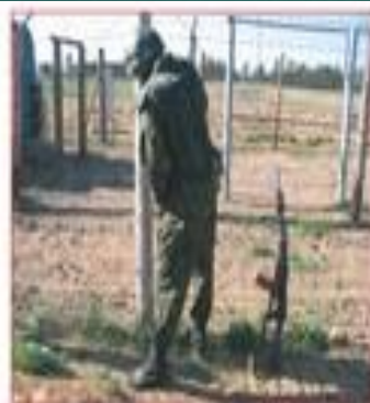
Оправлять естественные надобности