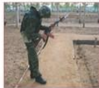
Досылать без надобности патрон в патронник