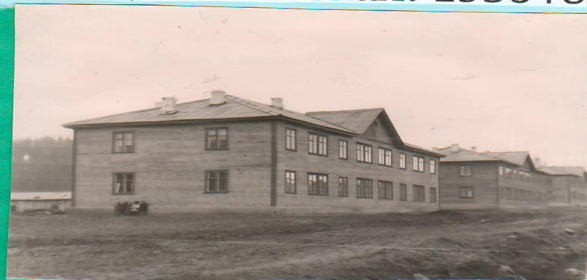
улица Свободы. 1956 год