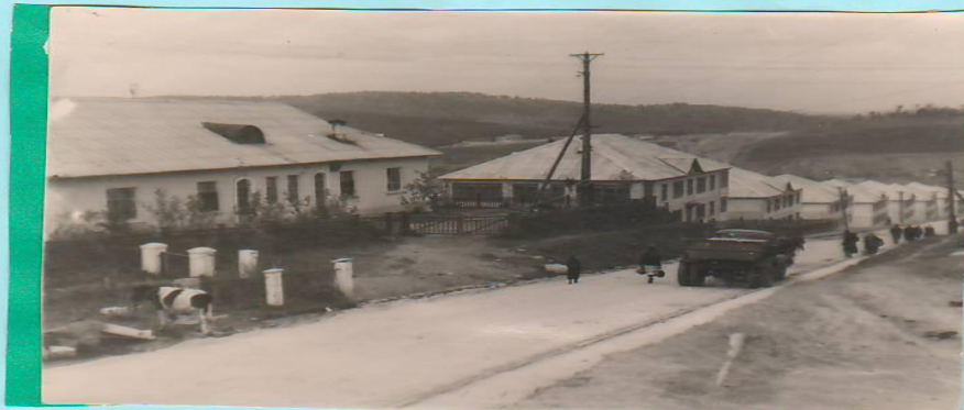
улица Чернышевского. 1956 год